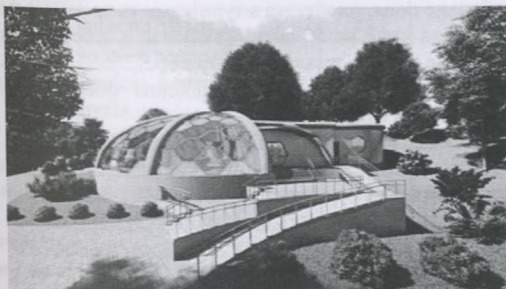
Рисунок 4. Кафе, головний вхід (перспективне зображення)

За основу композиції будівлі виступає обрізаний еліпсоїд який, наче, врізається в призму, еліпсоїд покритий вітражною стрижневою системою, яка тримається на опорах. Будівля має один поверх висотою 3,3 м. Головний вхід розташований з південного-сходу, до якого веде тераса зі сходами і пандусом (рис. 4).