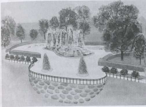
Рисунок 2. Головна площа з фонтаном (сформована на основі текучості доріжок)

В глибині острівків, сформованими зеленими насадженнями, розташовуються, ніби випадково, забудовані малі архітектурні форми (рис. 2).