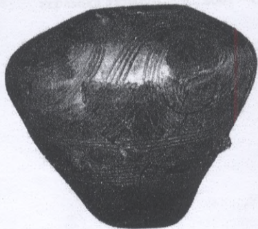
Рис. 2. Горщик – зерновик