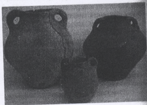
Рис. 3. Горщики з ручками

їх як культові посудини, які брали участь у магічних обрядах викликання дощу [5].