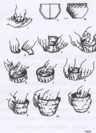
Рис. 4. Етапи формування посуду методом ліплення

Східнотрипільські майстри володіли технікою виконання заглибленого орнаменту. Часто посудини прикрашали рельєфні деталі у вигляді виступів, які витискувались із внутрішнього боку стінки посудини за допомогою палички. Методом