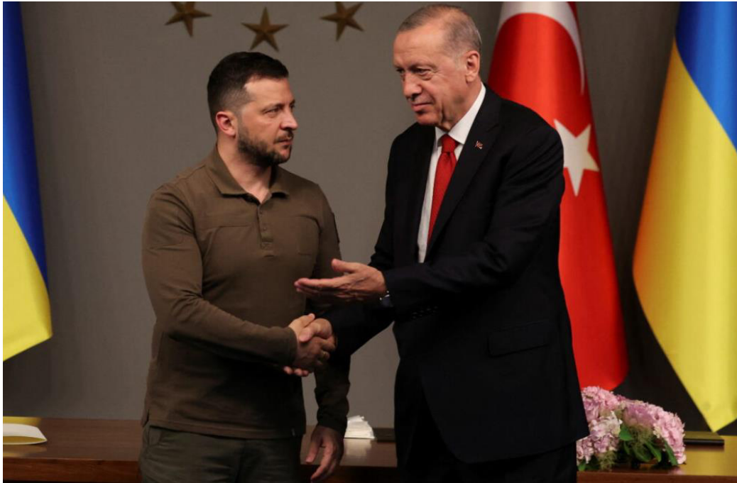
Рис. 3.1 Володимир Зеленський на зустрічі з Ердоганом

Підтримка суверенітету та територіальної цілісності України є одним із ключових аспектів політики Туреччини в контексті конфлікту на сході Європи. Президент Туреччини Реджеп Тайп Ердоган в березні 2022 року заявив про право України на захист територіальної цілісності, що підкреслило офіційну позицію країни. Крім того, Туреччина підтримала резолюції ООН, які засуджують вторгнення Росії.