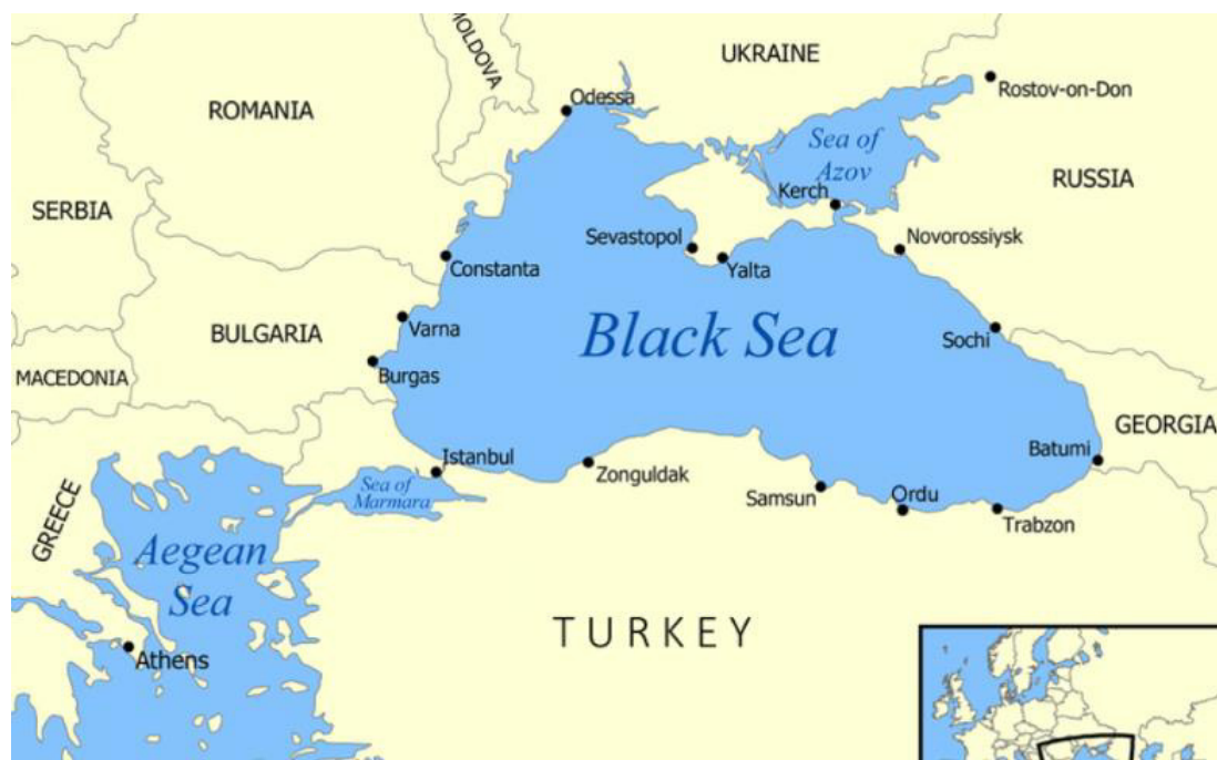
Рис. 2.1 Карта Чорного моря

У рамках багатовекторної політики Туреччина також активно співпрацювала з країнами Чорноморського регіону через різні формати, такі як Чорноморська економічна співпраця та Організація Чорноморського економічного співробітництва. Це сприяло розвитку торгівлі, інвестицій та спільних проєктів у регіоні, забезпечуючи Туреччині додаткові можливості для розширення своєї економічної бази.