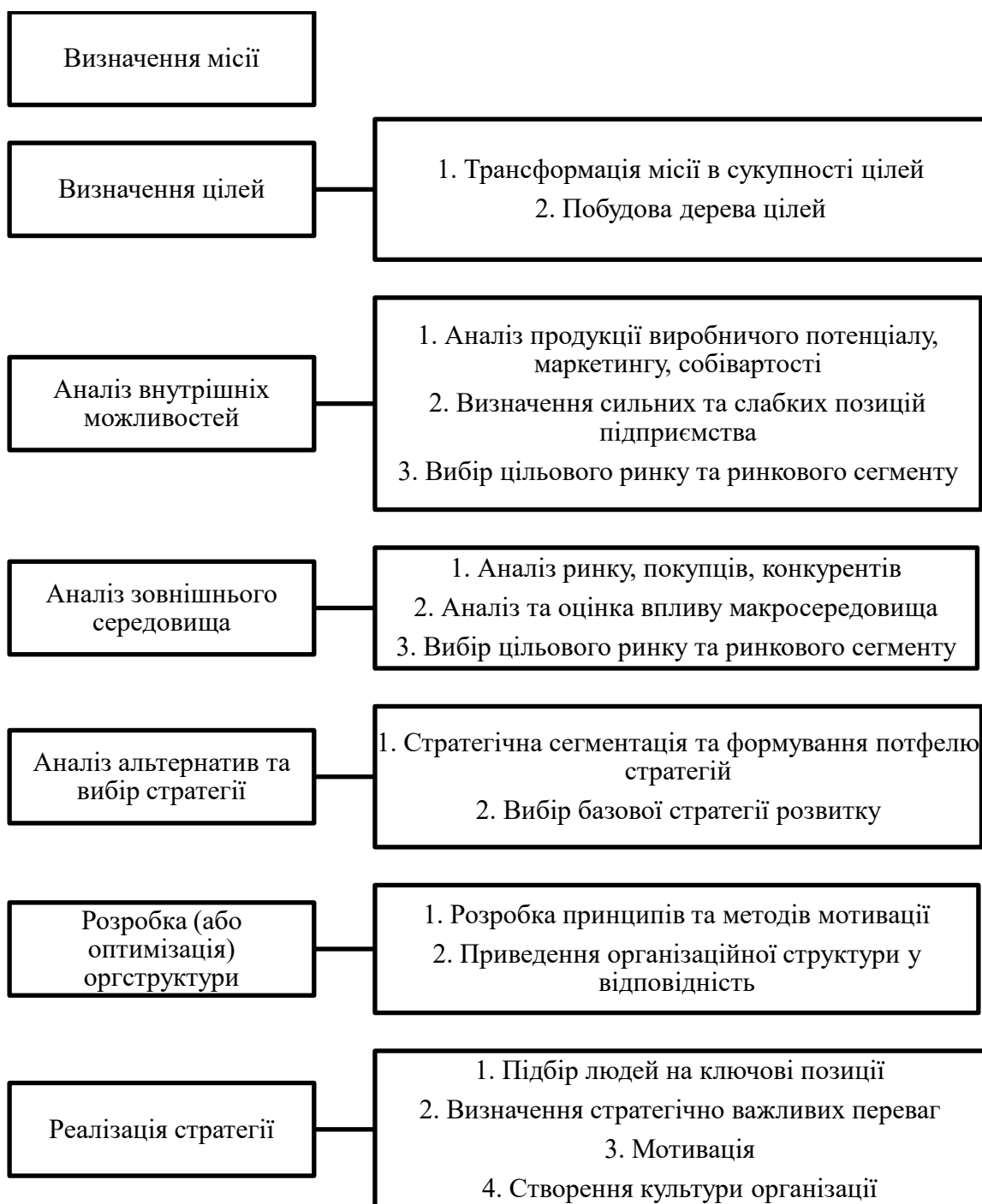
Рис. 1.2. Етапи розроблення стратегії просування

Під час розроблення контент-стратегії як комплексного просування сайту, з відповідними цілями (збільшення продажів, зростання лояльної аудиторії) та етапами (рис.1.2), доцільно визначити тип контенту, метод продажу; здійснити вибір каналів розповсюдження контенту.