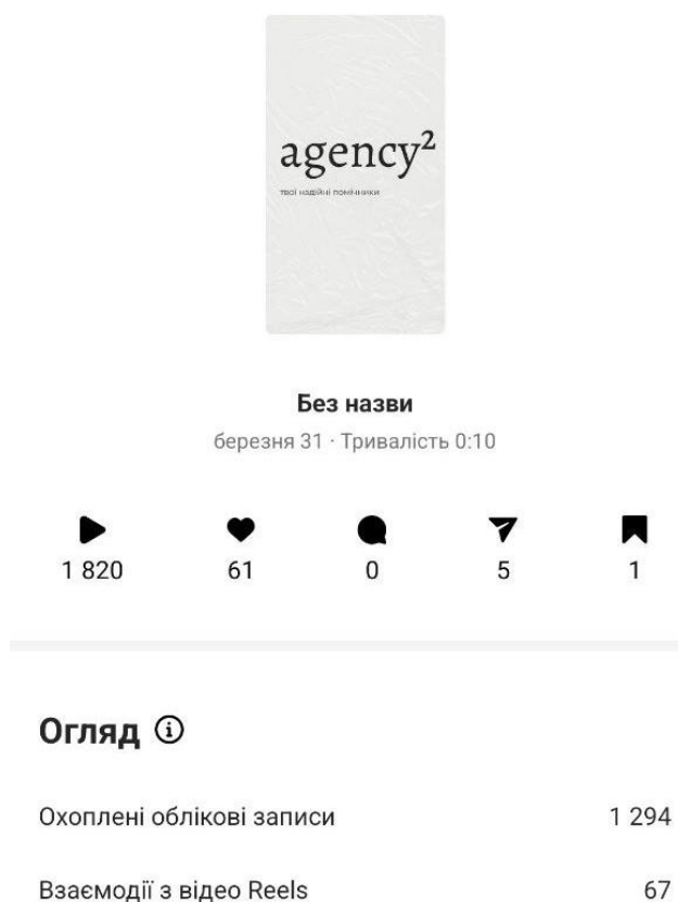
Рис. 2.1 Охоплення відео на сторінці «Agency2»

В епоху цифрового маркетингу і соціальних медіа, оцінка ефективності стратегії просування в інстаграм стає ключовим аспектом успішної діяльності будь-якого бізнесу чи бренду. Зростання популярності соціальної мережі «Інстаграм» являє собою не лише масштабну аудиторію, але й непередбачувану конкуренцію, що вимагає від компаній постійного вдосконалення та адаптації своїх стратегій. Оцінка ефективності дозволяє не лише визначити досягнення мети та визначити вдалі і неуспішні аспекти, але й оптимізувати ресурси та напрямки діяльності для максимального впливу на аудиторію.