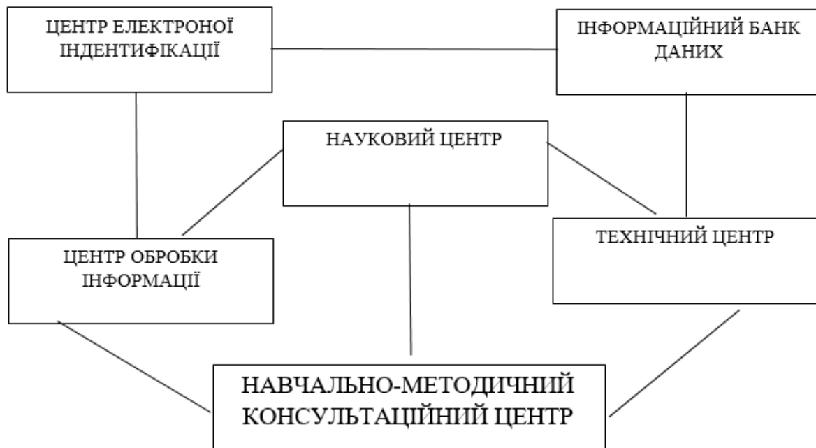
Рисунок 1 – Структура СІАЗ