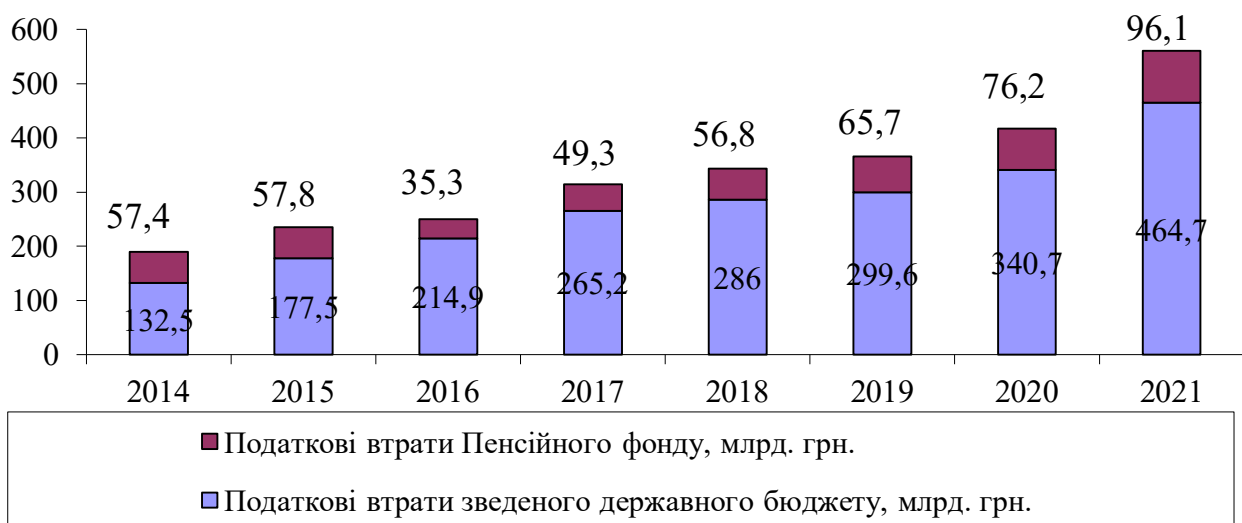
Рис. 2. Фіскальні втрати зведеного державного бюджету та Пенсійного фонду внаслідок тінізації національної економіки, млрд. грн.

Як бачимо, розрахунки свідчать, що протягом 2014-2021 рр. зведений державний бюджет зазнав суттєвих фіскальних втрат (від 133,5 млрд. грн у 2014 р. до 464,7 млрд. грн. у 2021 р.). В той же час, податкові втрати Пенсійного фонду є суттєво нижчими та у 2021 р. сягнули 96,1 млрд. грн.