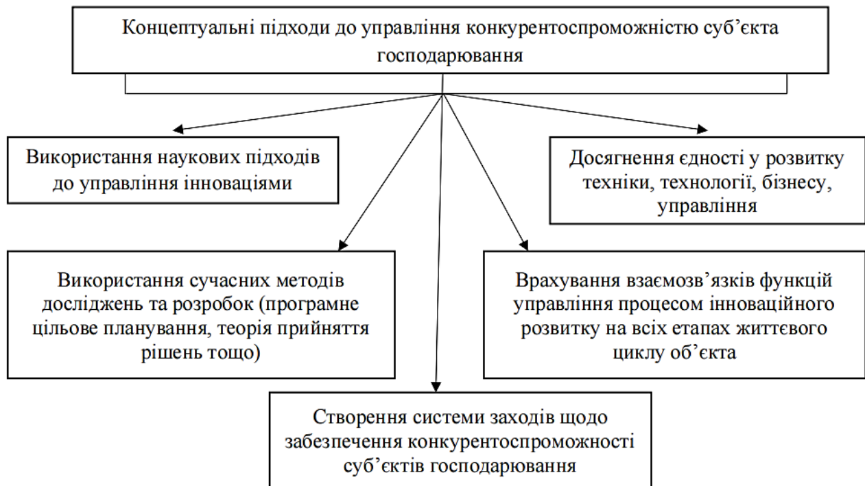
Рис. 2. Концептуальні підходи до управління конкурентоспроможністю суб'єкта господарювання

Концептуальні підходи до управління конкурентоспроможністю суб'єкта господарювання наведені на рис. 2.