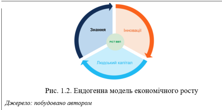
Рис. 2. Приклад оформлення ілюстрацій

Заголовки і підзаголовки граф таблиці вказують в однині.