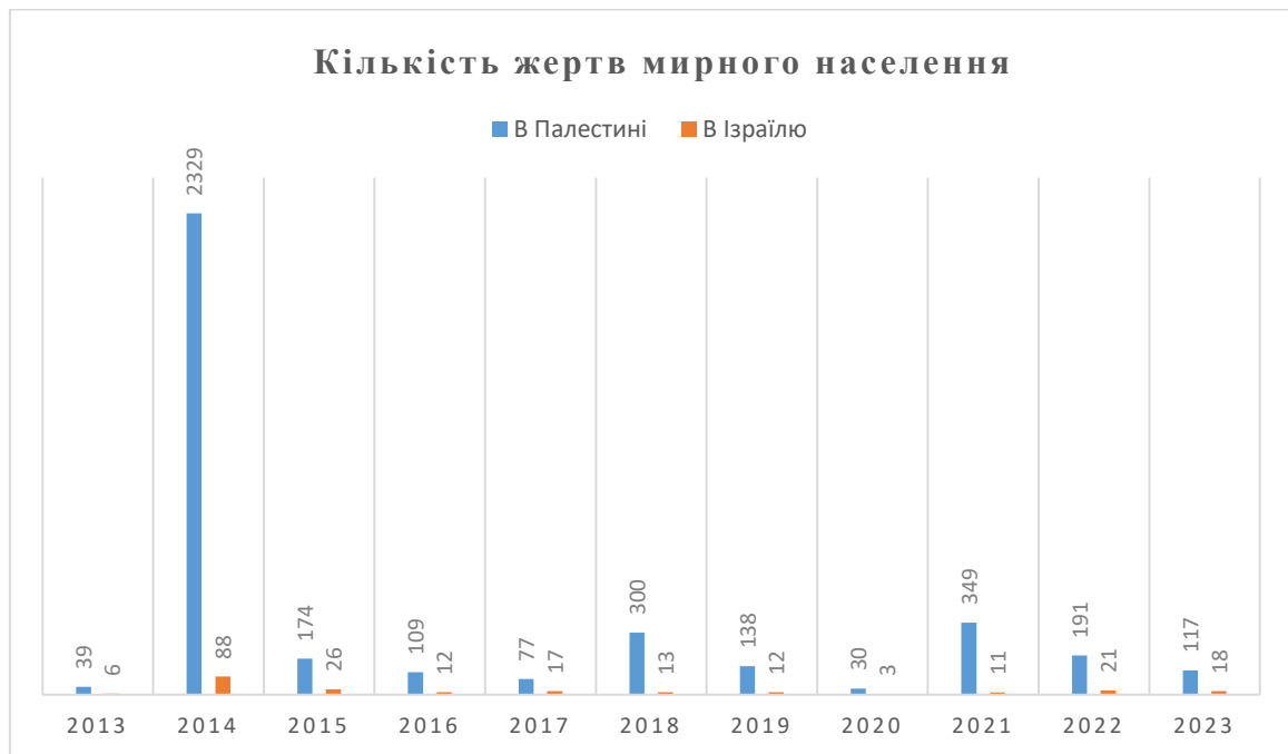
Рис. 2.1. Діаграма «Кількість жертв мирного населення в Палестині та в Ізраїлю з 2013 по 2023 роки» [50]

нагадуванням про системну неспроможність захистити основні права людини та гарантувати безпеку жителям регіону.