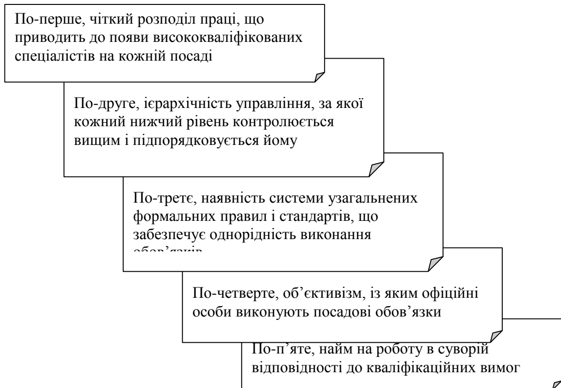
Рисунок 3 – Характеристики раціональної бюрократії

Концепція бюрократії (від французького «бюро», «канцелярія» або грецького «влада», «панування», букв. – планування канцелярії) була сформульована німецьким соціологом Максом Вебером на початку ХХ ст. і в ідеалі є однією з найкорисніших ідей в історії людства (рис. 3). Більшість сучасних організацій є варіантами бюрократії. Причина такого тривалого та широкомасштабного використання бюрократичних структур полягає у тому, що їх характеристики ще досить добре підходять для більшості промислових підприємств, організацій сфери послуг, усіх видів державних установ.