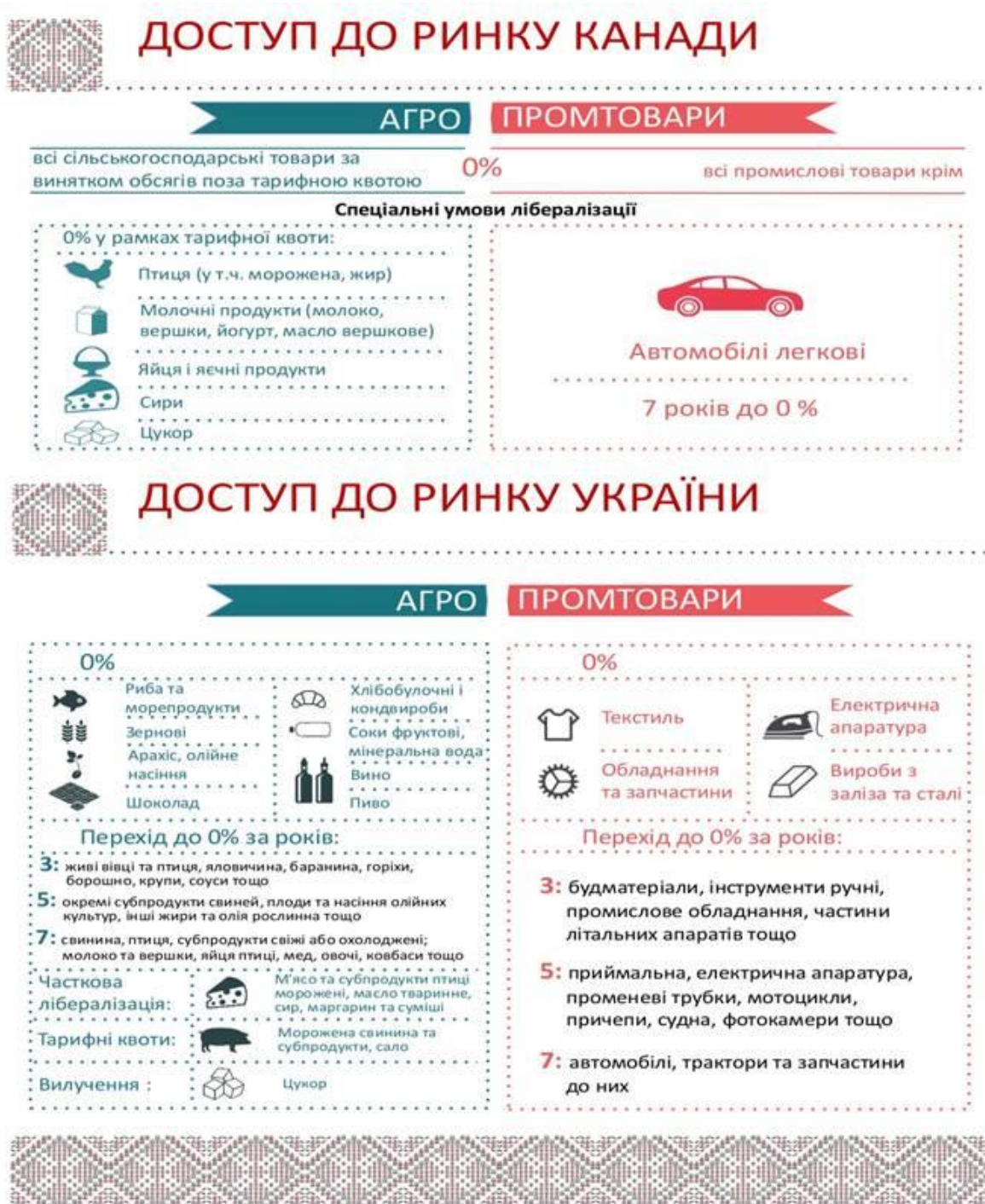
Рис. Доступ до ринків Канади та України