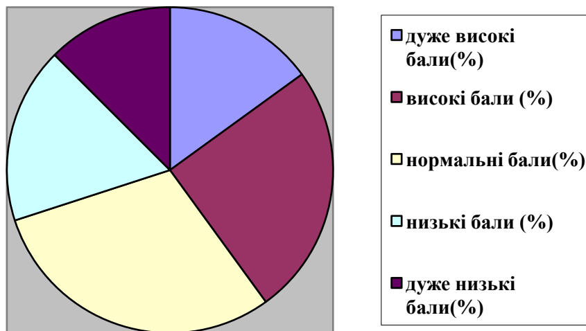
Рис.3.2 Показники самооцінки креативності за методикою Джонсона