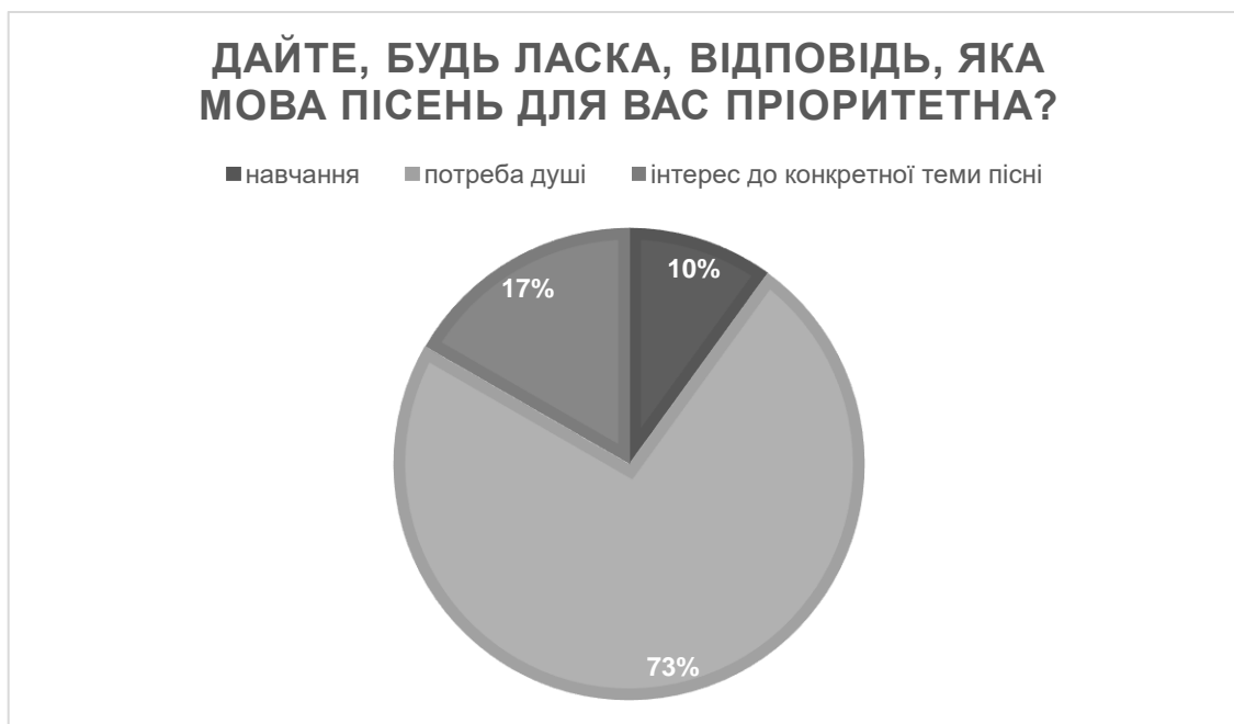
Рис. 2.2.4. Розподіл відповідей респондентів за четвертим питанням

За результатами анкети понад 50% (15) опитуваних підлітків не приділяють увагу мові на якій виконується композиція, 16,7% (5) підлітків приділяють час на прослуховування композицій на англійській мові, також 16,7%(5) підлітків слухають російськомовні пісні, та 16,7% (5) слухають україномовну музику.