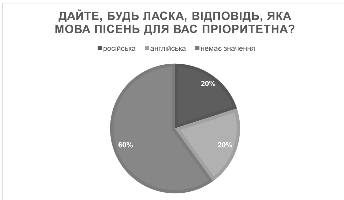
Рис. 2.2.3. Розподіл відповідей респондентів за третім питанням

За результатами анкети 60% (18) підлітків слухають музику по кілька годин на день, 20% (6) слухають кожного дня музику потроху, 20% (6) підлітків слухають музику тільки якщо знайдуть щось цікаве