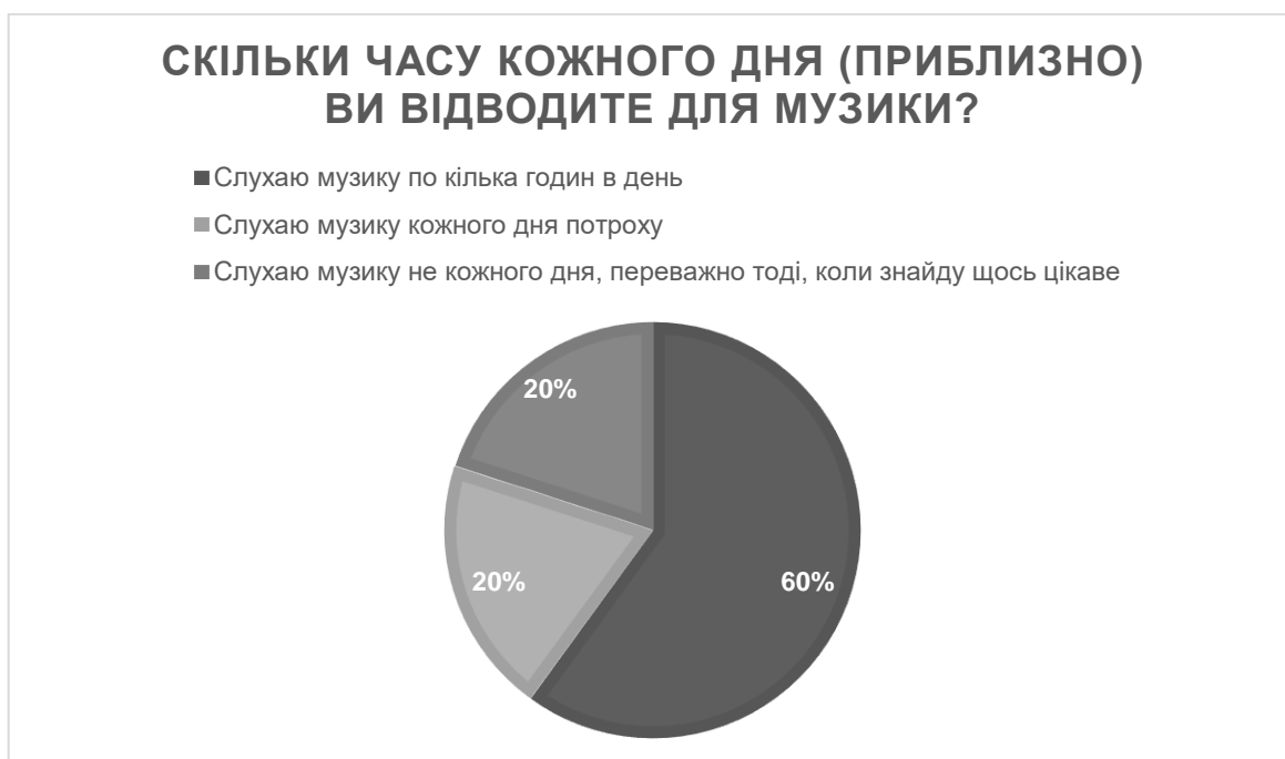
Рис. 2.2.2. Розподіл відповідей респондентів за другим питанням

За результатами аналізу анкети 76.7% (23) підлітків надають перевагу слуханню музики у вільний час, 13,3% (4) інколи слухають музику, а 10% (3) не витрачають свій вільний час на прослуховування музики