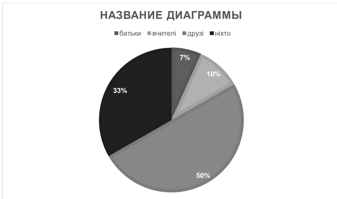
Рис. 2.2.5. Розподіл відповідей респондентів за п'ятим питанням

За результатами анкети найбільшим показником мотивів для прослухування музики є душевна потреба понад 73.3% (22), для 16.7% (5) опитуваних мотивуються для прослуховування музики інтересом до теми композиції або автору, 10% (3) опитуваних слухають музику для того щоб пізнавати більше інформацію