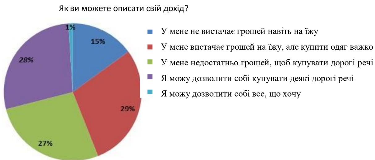
Рис. 3 Дохід респондентів

Судячи з додаткових питань, що покликані знайти істинність відповідей респондента, можна помітити, що більша кількість респондентів існують в приблизно однаковому соціальному прошарку, що різняться з відповідями респондентів на попереднє питання.