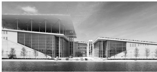
Рис. 3. Stavros niarchos foundation cultural center, Греція

У передмісті столиці Греції вдало розташувався культурний афінський центр «Stavros niarchos foundation cultural center», проєкт якого розробив видатний італійський архітектор Renzo Piano. Призначенням цієї надзвичайно красивої споруди є об'єднання Національної бібліотеки та Національної опери Греції. Центру надано образ штучного пагорбу, зорієнтованого на море. Функціональні простори опери та бібліотеки розташовуються в одній будівлі, але розділяються так званою «агорою», традиційною для Стародавньої Греції ринковою площею. Крило, в якому розміщується бібліотека, має прозорі стіни. Дах оформлений за допомогою фотогальванічних модулів, завдяки своїй конструкції він даватиме тінь і чудово захищатиме від спеки [3].