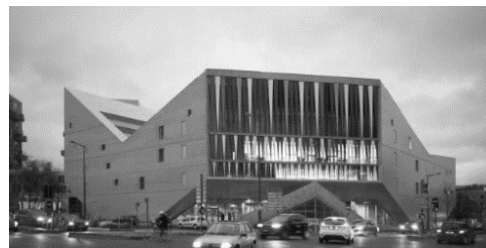
Рис.2. Молодіжний центр Euralille, Франція

У 2015 Бюро JDS architects представило новий молодіжний центр у місті Лілль на півночі Франції. Силует будівлі з багатьма кутами вдало відображує характерні риси молодого покоління європейців. У будівлі розмістився молодіжний хостел, дитячий садок та офіси. В структурі центру є свій сад, всередині якого легко усамітнитися та відпочити. Центральний масив будівлі ніби піднесено з двох боків. Незвичайне оформлення головного фасаду привертає увагу містян та робить споруду справжнім центром життя [2].