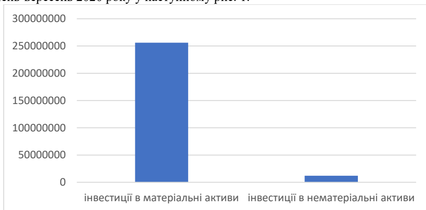
Рис. 1. Обсяги капітальних інвестицій за січень-червень 2020 року в Україні, тис. грн.

Ефективність діяльності підприємств тісно пов'язана з певними факторами. І незважаючи на ріст інвестицій в нематеріальні активи у високотехнологічних підприємств, матеріальні фактори і далі залишаються в пріоритеті для підприємств. Для наочності, наведемо дані, щодо капітальних інвестицій у матеріальні та нематеріальні активи вітчизняних підприємств за січень-вересень 2020 року у наступному рис. 1.