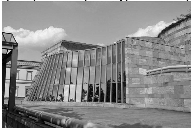
Рис.3 Архітектор – Джеймс Стерлінг, Державна галерея в Штутгарті

Пізня робота Джеймса Стерлінга – прибудова до Державної галереї в Штутгарті, мабуть, являється прикладом найбільш гармонійного поєднання різних стилів, таких характерних для архітектури постмодернізму (рис.3).