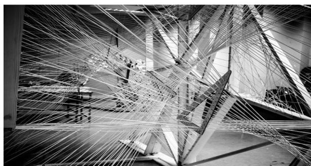
Рис. 6. ITKE Research Pavilion та "Kinetic Haze", Athens Athens Visiting School та University of Stuttgart

Висновки. Користуючись досвідом, творці мають визнати іншу концепцію постмодерну. Це буде спосіб гри з мовою, цінностями та концепціями, відмова від консенсусу щодо загального смаку, який може привести до ностальгії. Для втілення такої концепції необхідно щоб «постмодернізм» перетілювався в частину нової глобальної стильової течії, наприклад, «параметризм», який намагається творити більш інтелектуально побудований світ. Цілеспрямована архітектура параметризму має включати в себе гнучкість програми, формування навколишнього середовища та контекстуалізацію в міській тканині. Параметризм готовий стати основним рухом сучасної архітектури на тлі стильової війни.