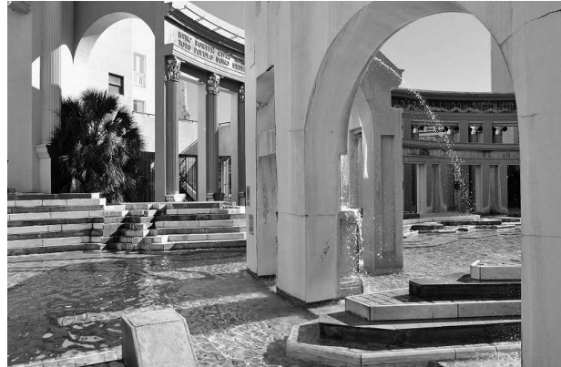
Рис.2 Площа Італії Чарльза Мура в Новому Орлеані (1976-1979 рр.)

З тих пір, поєднуючи елементи постмодерністського напрямку, а саме – іронічні ефекти, декоративні елементи, історичні цитати та символічні форми, багато архітекторів, натхнених самим поняттям «постмодернізм», продовжували виділяти елементи стилю з постійним акцентуванням форм. Проте за такого іронічного використання архітектурної мови, яка орієнтована на минуле лише як на спосіб створення нових форм, іноді постає прагнення уникнути будь-яких інновацій. Тому при розгляді постмодернізму як архітектурного жанру кожна наступна реактулізація може бути лише стилізацією і навіть мати риси фетишизації, що відображує заідеалізоване ставлення до створення архітектурних форм [2, 3].