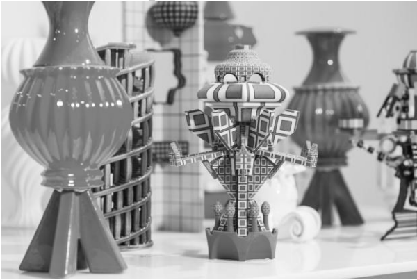
Рис.1 Адам Натаніель Фурман. «Парад ідентичності»

серію поетичних творів, які виникли у 60-х роках минулого століття, а потім циклічно повертаються до моди [6].