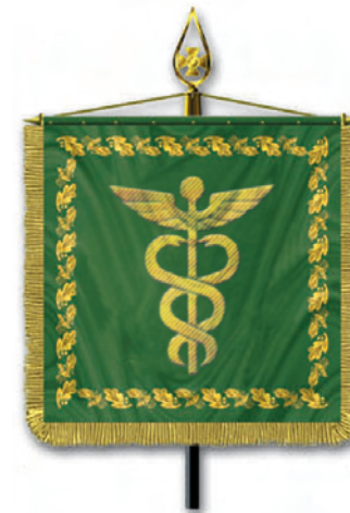
Штандарт Голови Державної податкової адміністрації України