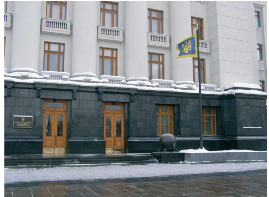
Прапор (штандарт) Президента України біля Адміністрації Президента України

орнаментом із жовтого металу. До основи верхівки древка оригіналу Прапора (штандарта) Президента України прикріплюється срібна пластинка з вигравіюваними прізвищем, ім'ям, по батькові Президента України та датою складення ним