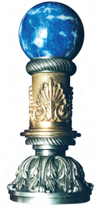
Гербова печатка Президента України

Гербова печатка Президента України використовується для засвідчення підпису Президента України на грамотах, посвідченнях до президентських відзнак та почесних звань України, а також на посланнях Президента України главам інших держав.