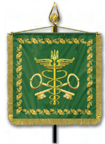
Штандарт Голови Державної митної служби України

Голови Державної митної служби України (від 27 червня 2003 року, № 554);