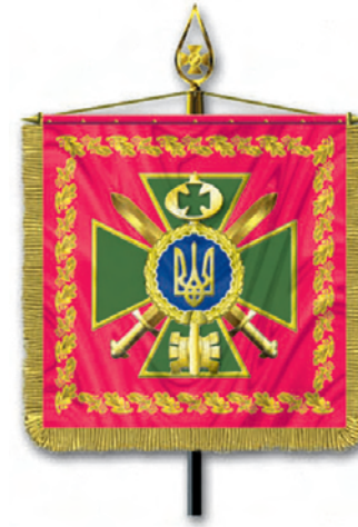
Штандарт Голови Державного комітету у справах охорони державного кордону України