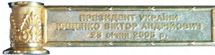
Срібна пластинка з вигравіюваними прізвищем, ім'ям, по батькові Президента України та датою складення ним присяги народіві

України має оригінал і дублікати, розміри яких відповідають меті їх використання.