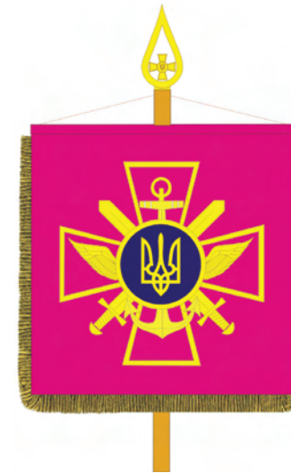
Штандарт начальника Генерального штабу Збройних Сил України