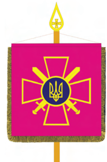
Штандарт командувача Сухопутних військ Збройних Сил України