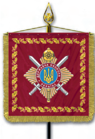
Штандарт Начальника Управління державної охорони України