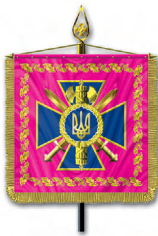
Штандарт Голови Служби безпеки України