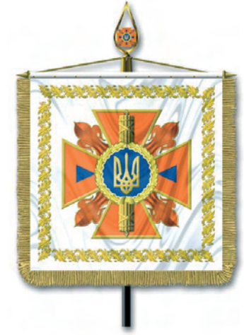
Штандарт Міністра України з питань надзвичайних ситуацій та у справах захисту населення від наслідків Чорнобильської катастрофи