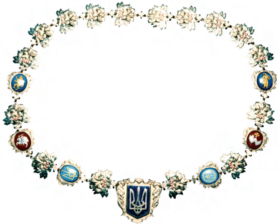
Знак Президента України

Знак Президента України виготовлений із жовтого та білого металу, всі його елементи з'єднані між