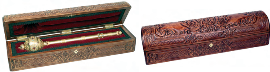
Булава Президента України та різьблена скринька, у якій вона зберігається