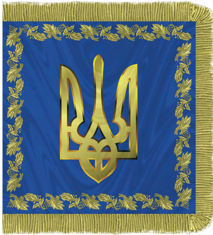
Прапор (штандарт) Президента України