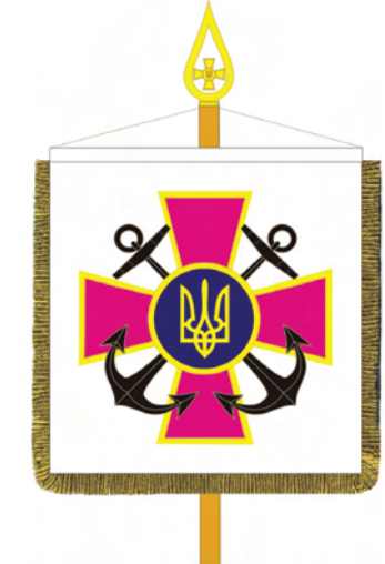
Штандарт командувача Військово-Морських Сил Збройних Сил України