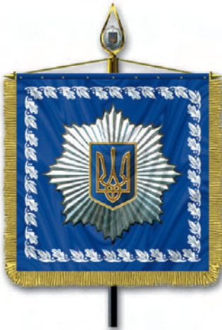
Штандарт Міністра внутрішніх справ України