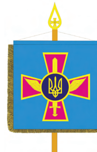
Штандарт командувача Військово-Повітряних Сил Збройних Сил України