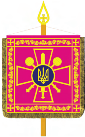
Штандарт Міністра оборони України