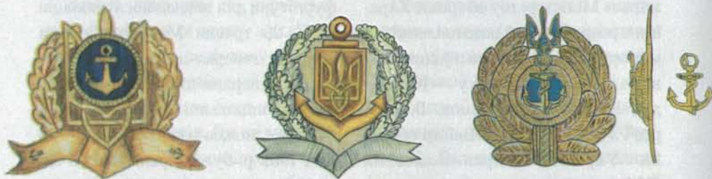
Ескізни проекти кокарди для військовослужбовців ВМС ЗСУ. 1993 р.