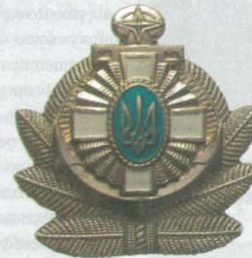
Кокарда для офіцерів ВМС ЗС України. 1994 р.