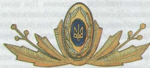
Кокарда для генералів, опрацьована ЦНДЛ з розробки форми одягу. Для генерал-полковника та генерала армії на козирьок кашкета додається шитво стилізованого вінка з листя калини. 1994 р.