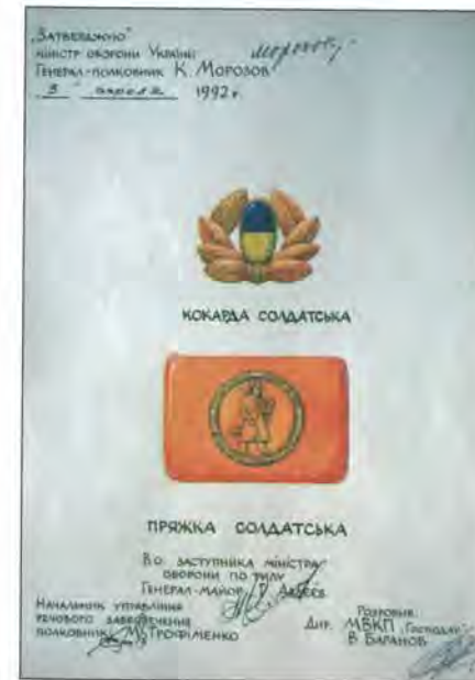
Ескізи кокард, пряжки й гудзиків, які затвердив Міністр оборони України генерал-полковник К.Морозов. 3 квітня 1992 р.

магало Міністерству оборони України в розробленні й виготовленні арматури. Відомі автори гудзиків до військової форми одягу – К.Трейдін, В.Гриценко, В.Іванов, В.Бокарев 1 . 3 квітня 1992 р. Міністр оборони України генерал-полковник К.Морозов затвердив ескізи гудзиків, парадної, повсякденної і польової кокард для військовослужбовців ЗСУ та парадної і повсякденної кокарди й пряжки до ремня для солдатів 2 .