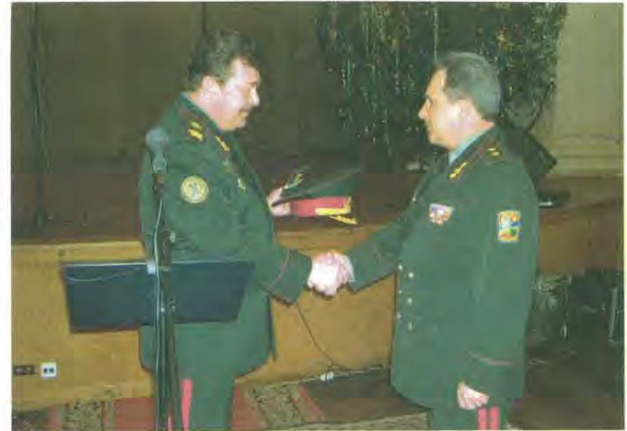
Міністр оборони України генерал армії О.Кузьмук вручає погони й кашкет генерал-полковника начальника Генерального штабу ЗС України генерал-лейтенанта О.Кириченку. Грудень, 2004 р.

також часів Визвольних змагань початку ХХ ст. Друга тенденція, сказати б, інерційна базувалася на досягненнях радянської школи емблематики, пропонуючи лише деякі невеликі видозміни форми емблем, заміну на них суто радянської атрибутики на українську державну та використання військової арматури як символів видів збройних сил.