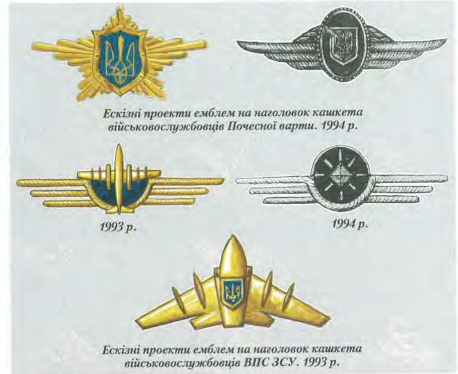
Ескізи проекти емблем на наголовок кашкета військовослужбовців Почесної варті. 1994 р.