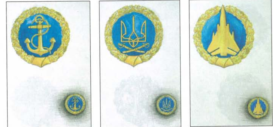
Ескізни пропозиції емблеми у виконанні В.Петровського. 1993 р.