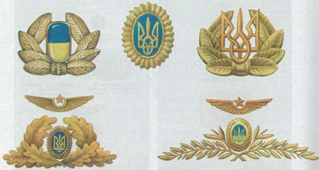
Проекти кокард для солдатів, офіцерів та генералів ЗС України, виконані В.Барановим. 1992 р.