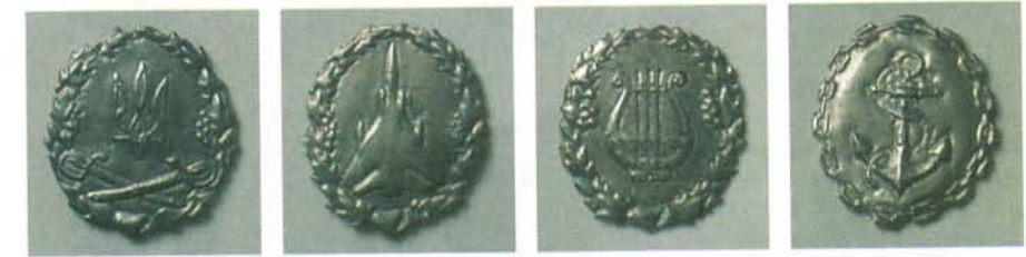
Зразки емблем видів Збройних сил В.Петровського, виготовлені ДТВА „Укркінокадр”. Вересень, 1993 р.