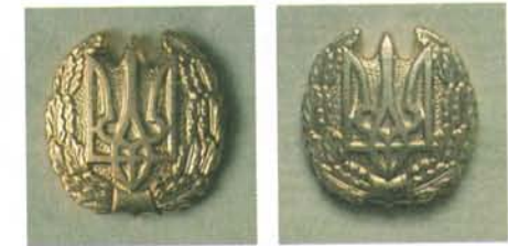
Зразок загальновійськової емблеми ЗСУ. Грудень, 1992 р.