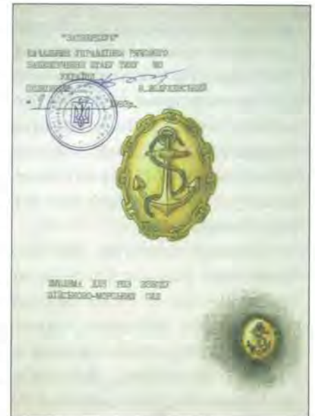
Емблема взводу ВМС роти Почесної варті. 1993 р.

Цілковито новою стала емблема морської піхоти ВМС України. Завдяки вдалій композиції вона від часу опрацювання її в серпні 1993 р. й дотепер не зазнала змін. Центром емблеми є овальний щит блакитного кольору з сріблястою облямівкою у вигляді канта, на щит покладено морський якор, на якому розміщено меч вістрям догори з двома крилами по боках, що виходять з руків'я меча. Цю композицію покладено в основі на лавровий вінок, який охоплює щит з двох боків. Емблему розробили в управлінні ВМС ГШ ЗС України під керівництвом підполковника Волошина 8 .