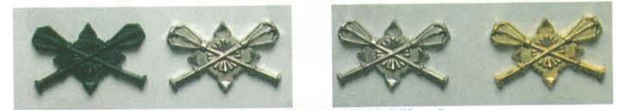
Зразки емблем офіцерів ГШ ЗС України