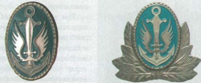
Кокарди для військовослужбовців підрозділів морської піхоти ВМС ЗС України. 1993 р.