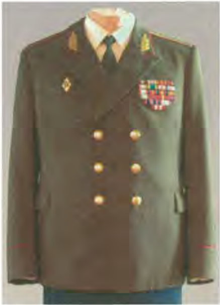
Кітель начальника Головного штабу Збройних Сил України генерал-лейтенанта Г.Живиці. 1992 р.