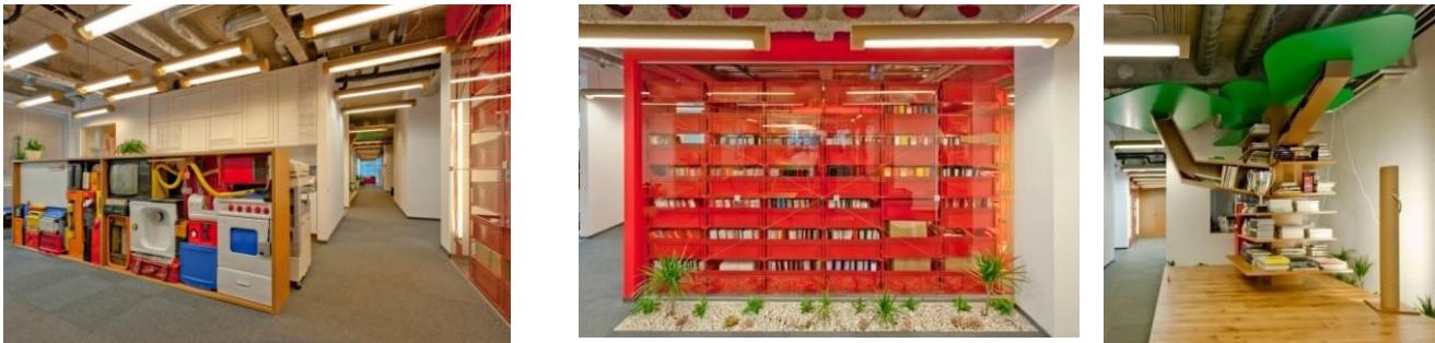
Рис. 4. Офіс міжнародного рекламного агентства McCann Erickson – Riga,

Висновки. Сфера застосування Trash-дизайну надзвичайно широка: від окремих елементів промдизайну до формоутворення середовища та дизайну одягу, при використанні вторинної сировини у формоутворенні середовища та виготовленні арт-об'єктів.