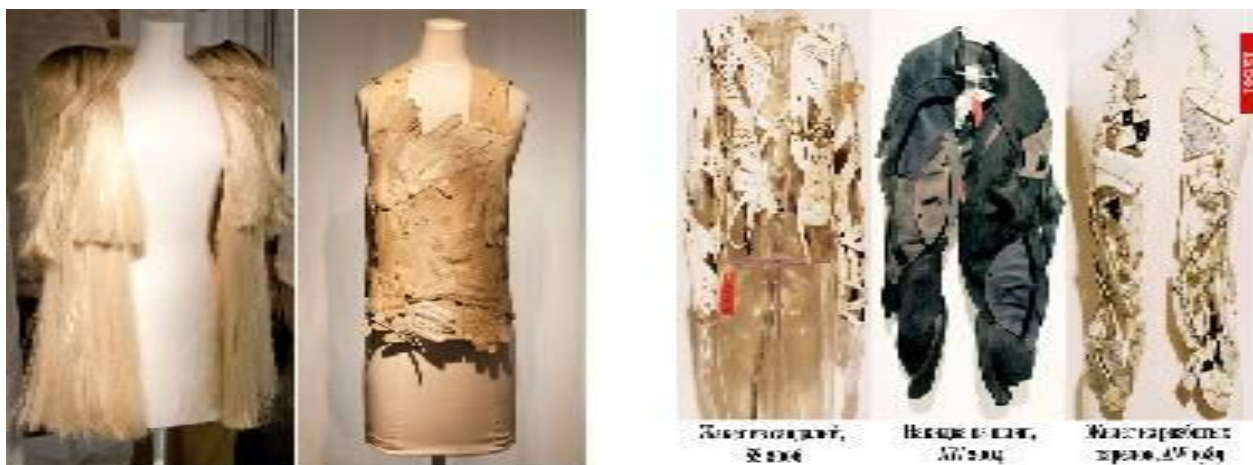
Рис. 3. Топ із рукавичок , жилети з капелюхів і розбитих тарілок

(рис. 3). Такі ексклюзивні моделі виготовляються в одиничних екземплярах, і коштують по кілька тисяч євро, часто потрапляючи до музейних колекцій [2].