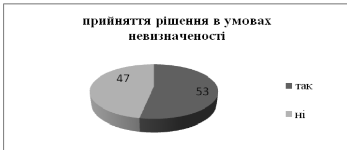
Рис.1. Прийняття рішення командирами в умовах невизначеності.

подібної ситуації в них не було (рис.1).