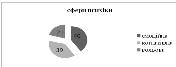
Рис.2 Вплив складових психіки на прийняття рішення командиром

На питання, в якій із сфер психіки у вас викликає найбільше напруження саме прийняття рішення в неоднозначній, протилежній, невизначеній ситуації, командири вказали на емоційну (40%) та інтелектуальну сферу (39%). Деяко менший рівень напруження командири відчувають у вольовій сфері (21%) (рис.2).