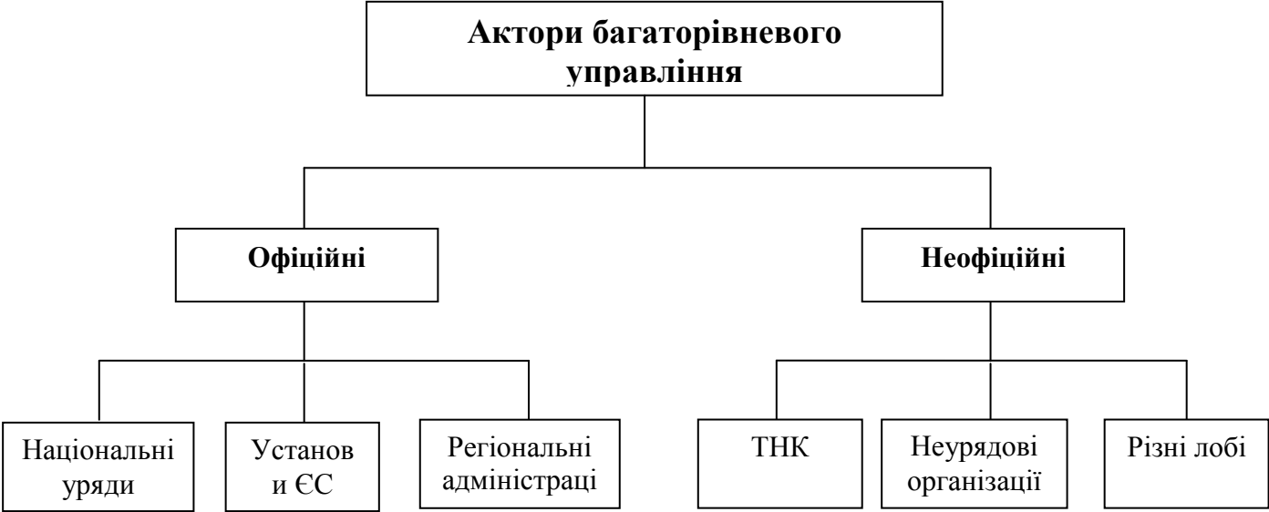
Рис. 2.13 Горизонтальні мережі взаємодії та ухвали рішень в ЄС