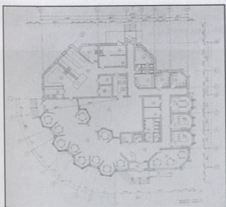
Рисунок 3. Кафе «Мезозой» (план на від.0,000).

Для задоволення потреб відвідувачів парку пропонується побудувати заклад громадського харчування – молодіжне кафе на 50 місць загальною площею 704 кв. м. Одноповерхова будівля має складне архітектурно-планувальне рішення (рис.3).