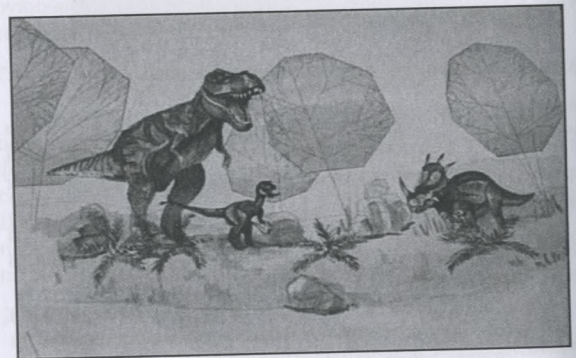
Рисунок 1. Концептуальні рішення реорганізації території парку (фрагмент).

Проектом передбачено розміщення окремих скульптур та скульптурних композицій (рис. 1), оригінального за формою та режимом роботи фонтану, інших архітектурних елементів, які повинні створити атмосферу перебування в первісному світі.