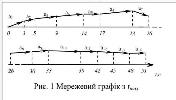
Рис. 1 Мережевий графік з t_{max}

За отриманими даними побудовано мережевий графік, який відображає максимальний час на виконання необхідних дій авіадиспетчером (рис.1). Цей час становить 51 секунду.