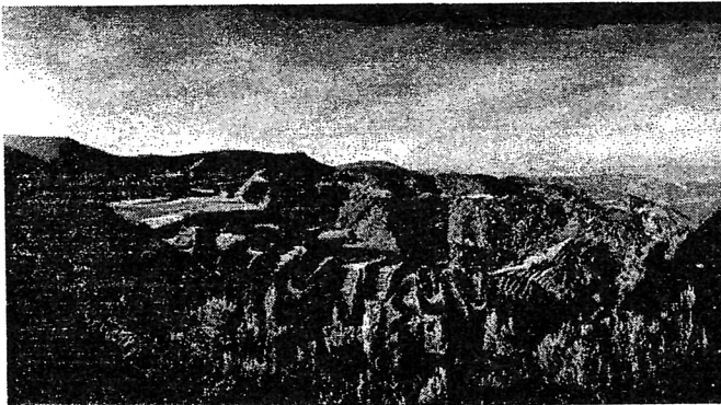
рис.2 Ландшафтна реконструкція долини Джоан, Барселона.

Окрім відновлення земель та інтеграції в навколишній ландшафт, метою цього проекту було показати суспільству нові методи дбайливого ставлення до навколишнього середовища. Проект «Долина Джоан» був удостоєний першої премії у номінації «Енергія, відходи, рециклінг» на Міжнародному Фестивалі Архітектури (WAF) у Барселоні у 2008 році. Це прекрасний приклад того, як мертва природа повертається до життя шляхом перетворення смітника у красивий куточок ландшафту, причому за досить скромні кошти. Крім того, проектувальники запевняють, що проект є сталим.