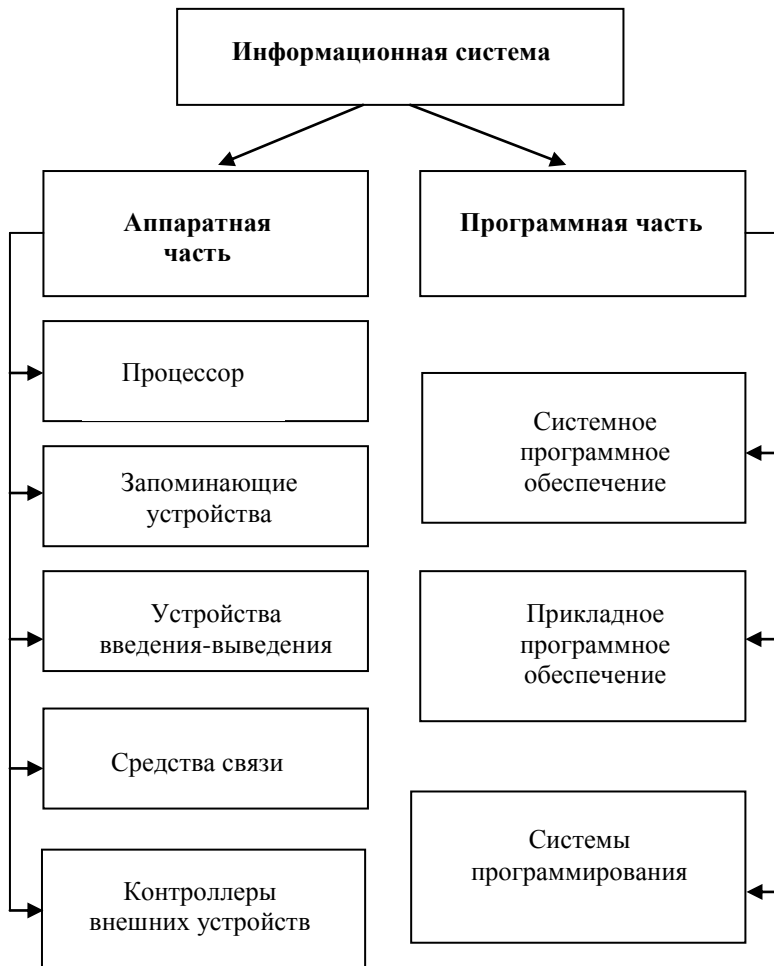
Рис.2. Информационная система

Информационная система – это совокупность аппаратных и программных средств, обеспечивающих автоматизацию обработки информации (рис.2).