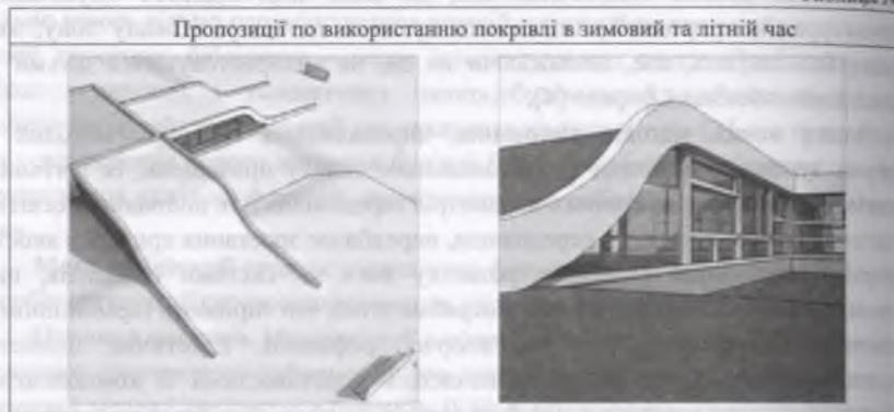
Таблиця № 1

В рамках оптимізації функціонально-планувальної структури архітектурного середовища для дошкільної освіти необхідно забезпечити гнучкість та мобільність, функціональну універсальність та просторову варіативність, вікову диференціацію і регульовану автономність планувальної структури ДДЗ. Наведений ряд напрямків вдосконалення середовища дитячих дошкільних закладів може бути реалізований при використанні наступних прийомів.