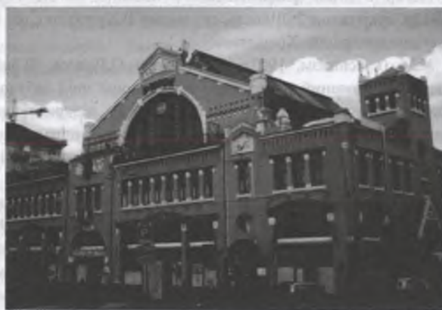
Рис.3. Бессарабський ринок 1934

мотивами. Так, фасад будівлі (61 метр довжиною) прикрашений великими вітринами традиційної та аркової форми, рельєфами скульпторів Т.Руденка та О.Теремця, квітами, орнаментами з цегли. Вражає металопластика на ґратах воріт, де зображені табуни качок, над воротами - бичачі голови, що відбивало народні мотиви, які природно поєднувалися з модерно-раціоналістичною стилістикою [7].