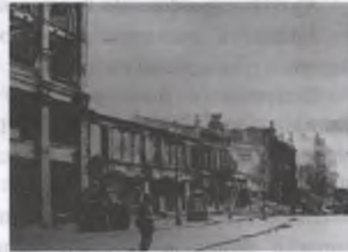
Рис. 1, рис. 2. Хрещатик після вибухів та пожеж 1941р.

Вибухи і пожежі, що послідували потім, були настільки могутніми, що центр міста повністю і під час війни не відновлювався [11].