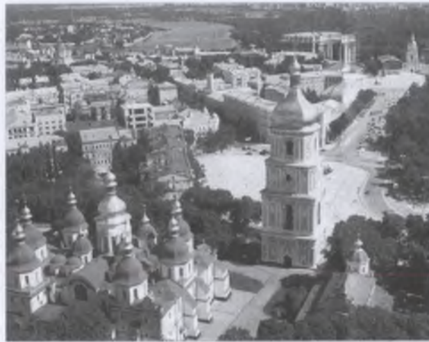
Saint Sophia. წმ. სოფია.

ასეთ პირობებში, უკრაინის არქიტექტორთა ეროვნული კავშირის და უკრაინის არქიტექტურის აკადემიის მიერ ჩატარებული იქნა საპროექტო ტენდერები, რომელთა მიზანი იყო ბუფერული ზონის რევალორიზაციის ძირითადი პრინციპების დადგენა. ბოლო ასეთი