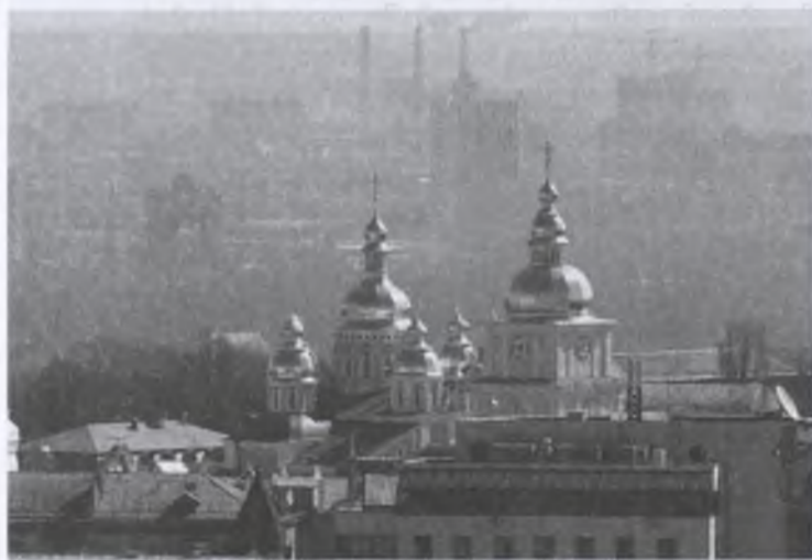
Panorama Mihailovsky Goldendomes Cathedral მიხეილის ოქროსგუმბათოვანი კათედრალის პანორამა

ტაძრის გარდა, არქიტექტურული ნაკრძალის ტერიტორია მოიცავს კიდევ 11 შენობას, მათ შორის, მე-18 საუკუნეში პოლტავის ბრძოლაში გამარჯვების აღსანიშნავად აგებულ სამრეკლოს, სატრაპეზოს, ბერების საცხოვრებელს და სენაკებს. ეკლესიასთან ერთად სამრეკლო ქმნის სოფიისკას მოედნის არქიტექტურულ ანსამბლს. ძირითადი ვიზუალური ხაზი წმ. სოფიას მე-12 საუკუნეში აგებულ, 1937 წელს დანგრეულ და 1997 წელს აღდგენილ წმ. მიხეილის ოქროს გუმბათების ტაძართან აკავშირებს. წმ. სოფიას სამრეკლოდან იშლება წმ. მიხეილის ხედი. ეს ორი კათედრალი ერთმანეთს ერწყმის და ქალაქის მთავარი ქუჩის, ხრეშჩატკის შორეული კუთხიდან დანახული ქმნის ქალაქის ზედა ნაწილის ერთიან პანორამას.