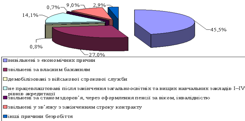
Рис.2 . Безробітне населення за причинами незайнятості у 2011 році, %

Загальна чисельність економічно неактивного населення останніми роками має тенденцію до скорочення (рис.3), що можна пов'язати зі зниженням доходів та існуванням необхідності більш активної участі у фінансуванні витрат домогосподарств. Так у жовтні 2012 року допомога побезробіттю в середньому складала 993 грн., в той же час прожитковий рівень і мінімальна заробітна плата - 1118 грн. за місяць.