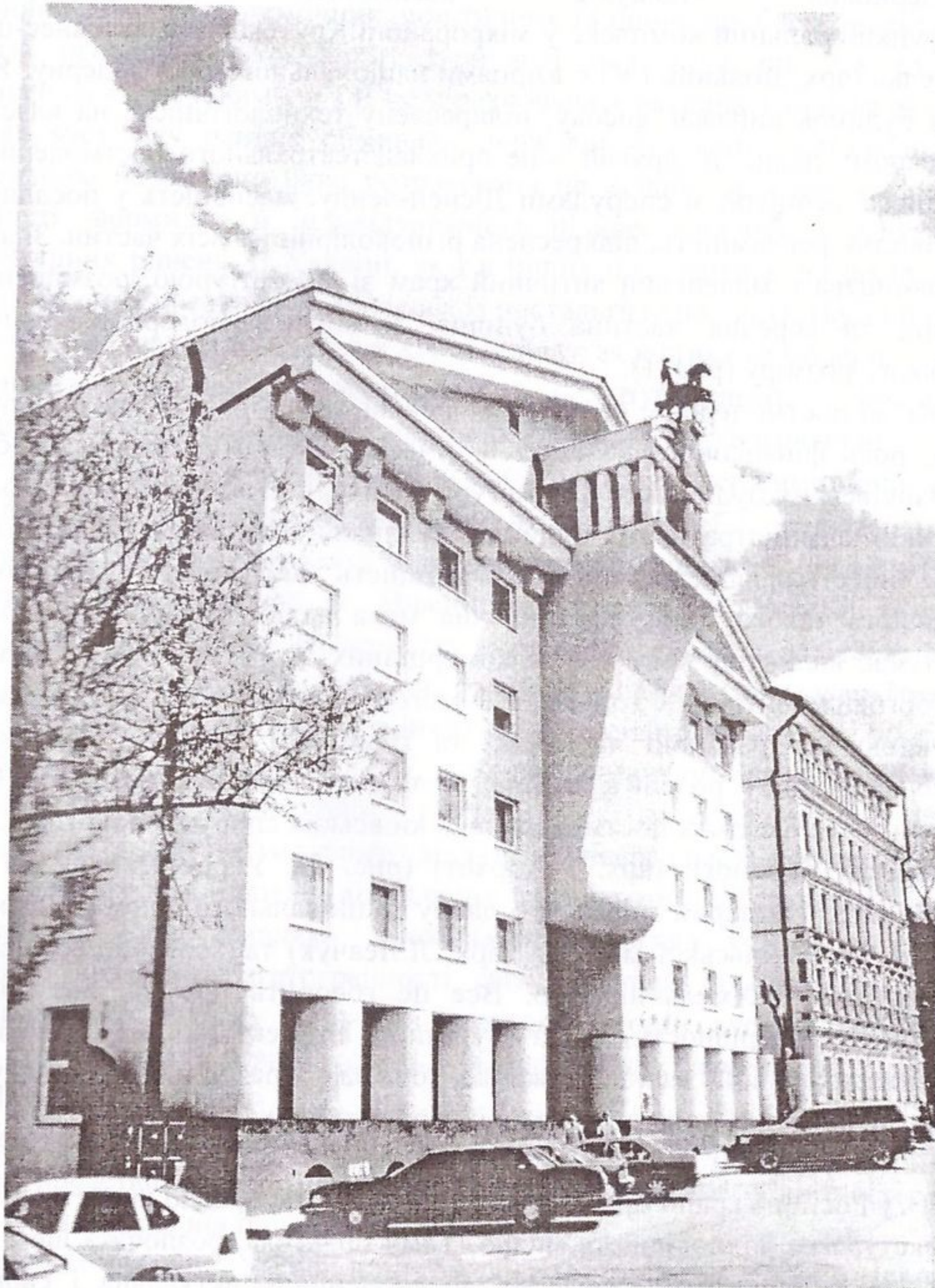
Рис.1. Бізнес-центр «Цитадель» у Дніпропетровську (арх. Дольник і К)

стають у ньому майже непомітними. Так, наприклад, офісний будинок (арх. С.Бабушкін, А.Мазур, Є.Яновицький) на вулиці Володимирській в Києві: розміщений у лінійному ряду старих київських будинків, вип'ячений дзеркальний круглий об'єм, в якому відображаються прилеглі будинки (слік-тек) – не лінійна, а кутова споруда, дещо брутална, але в ній присутність і відсутність одночасні (рис. 3).