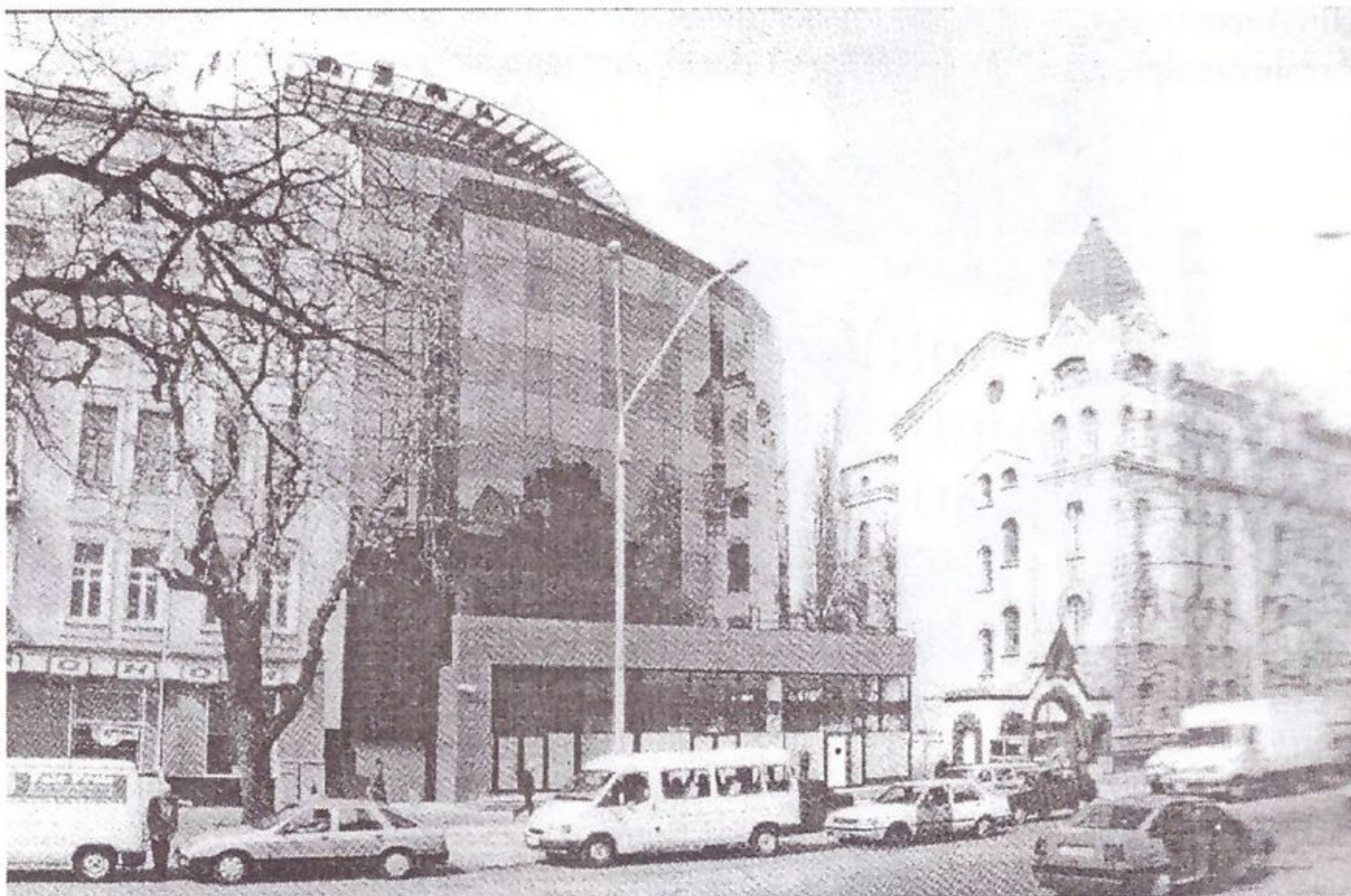
Рис. 3. Офісний будинок на вул. Володимирській у Києві (арх. С.Бабушкін, А.Мазур, Є.Яновицький)

будівель-комплексів різного призначення, вирішених разом із містобудівними проблемами.