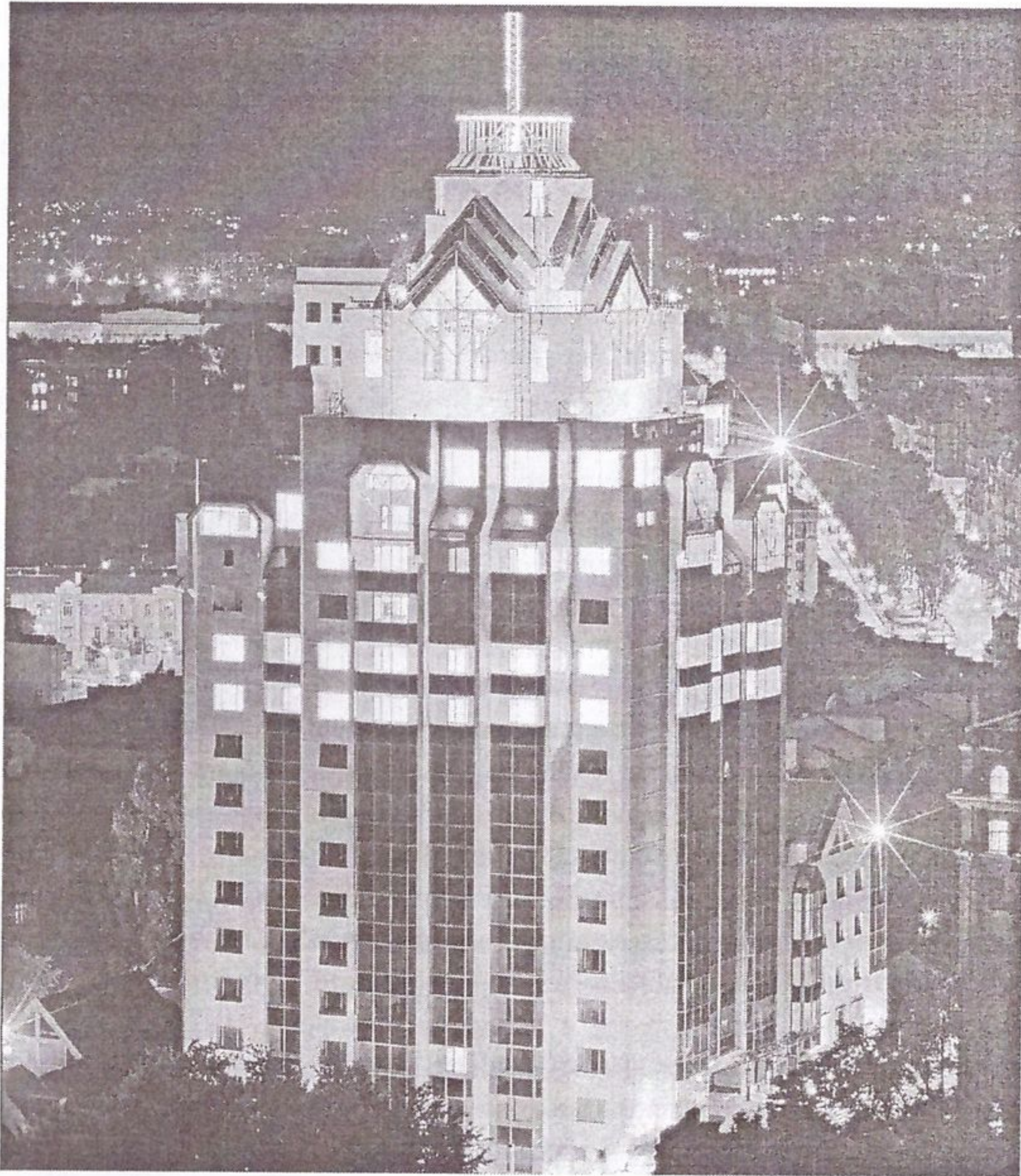
Рис.4. Готельно-офісний комплекс на Шовковичній вулиці (арх. ПТАМ «О.Комаровський»)

АБВ на вулицях П'ятницькій і Третій Тверській-Ямській у Москві, офісно-комерційний центр у Шевченківському районі Києва (арх. НПАБ «Ліценз і арх.»), новий Південний вокзал та у багатьох ще нереалізованих проектах.