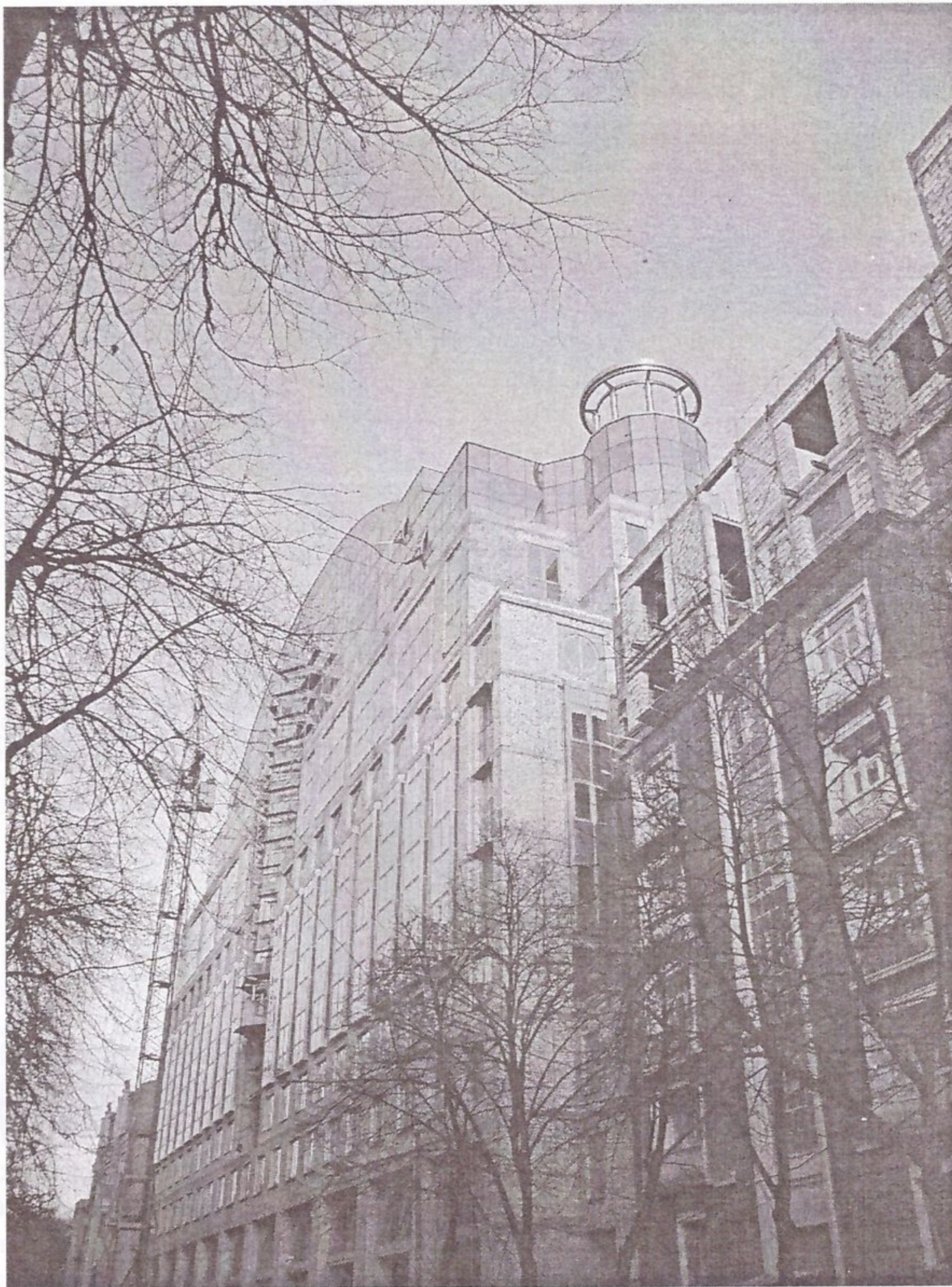
Рис. 5. Адміністративний будинок Верховної Ради України (арх. ПТАМ «О.Комаровський»)