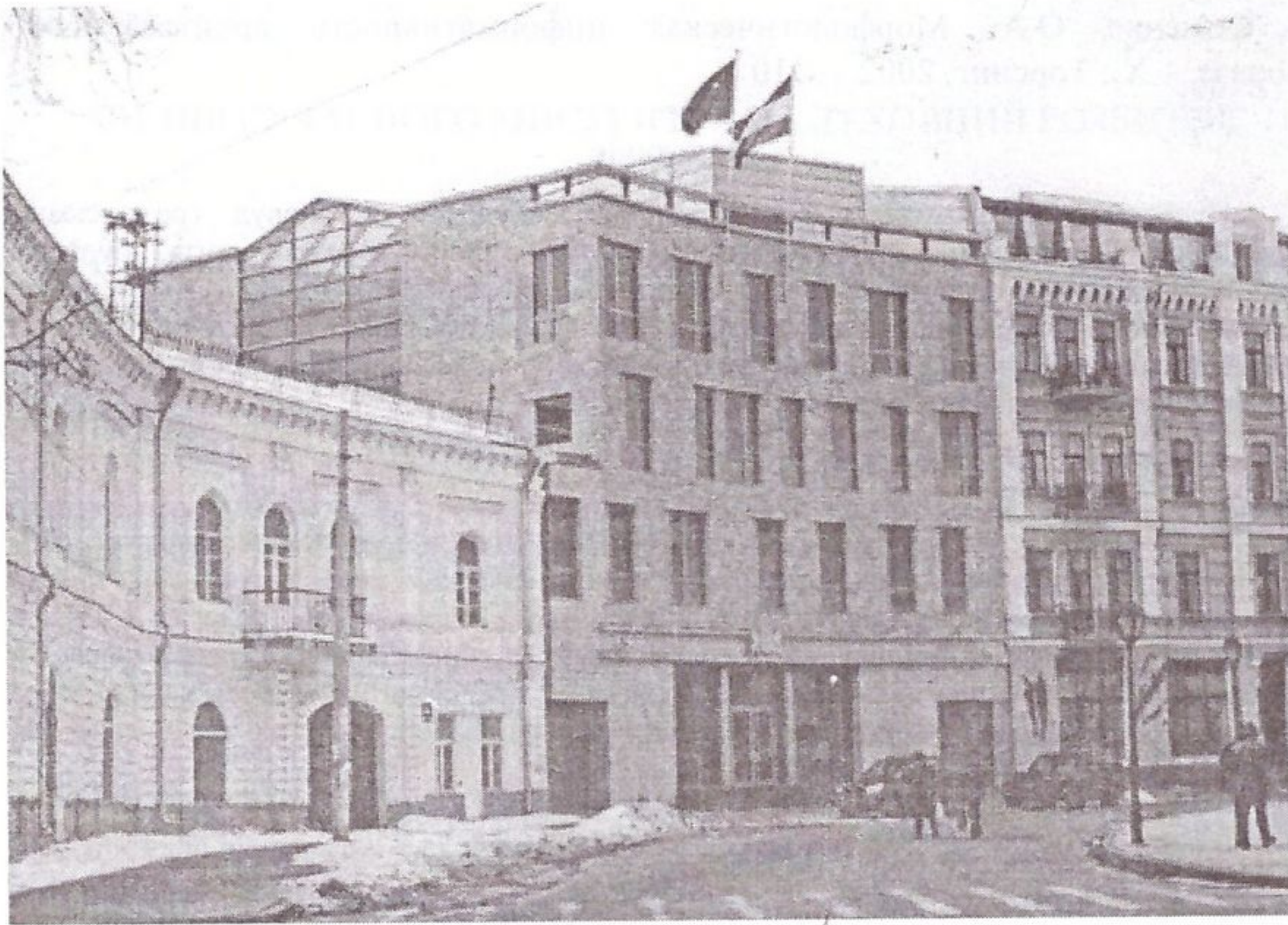
Рис. 6. Посольство Королівства Нідерланди (арх. «Atelser PRO», Гаага, «Гаразд-гурт архітектура», Київ)

Висновки. В останнє десятиліття, з переходом на ринкові відносини, прагнення представництва, престижу стає характерним майже для кожної типологічної групи споруд, але найбільш повно ця тенденція проявляється у торговельних будівлях, кафе, ресторанах та ін., де увагу потенційних покупців залучають незвичні форми, виконані у сучасних матеріалах і конструкціях, помітні входи у поєднанні з графічною рекламою. Їх архітектура зазіхається на звання представницької, оскільки представляє не тільки вид діяльності чи торгівлі, а й достаток і певну владу хазяїв, віру в непохитність такого стану.