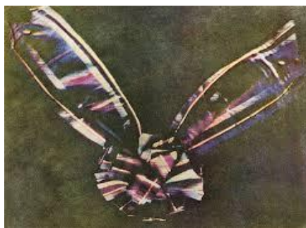
Рис. 1.2. Перша в світі кольорова фотографія

У 1861 році Джеймс Клерк Максвелл, шотландський вчений, на лекції в Королівському інституті у Лондоні продемонстрував першу в світі кольорову фотографію. Вона увійшла в історію під назвою «Тартанова стрічка» (рис. 1.2).