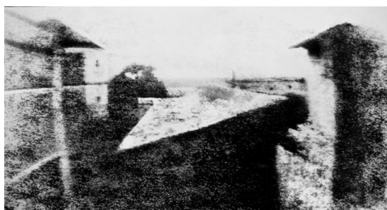
Рис. 1.1. Перша і найстаріша фотографія «Вид з вікна на Le Gras», зроблена Ж. Ньєпсом у 1826 р.

датується 1826 роком і носить назву «Вид із вікна в Ле Гра» (рис. 1.1). Ньєпс зобразив вид з вікна, тобто дахи сусідніх будинків. За цей час освітлення, природно, сильно змінювалося, так що знімок вийшов досить дивним, а вигляд з вікна на ньому не занадто впізнаваним. Жозеф вперше зміг закріпити зображення всередині камери-обскури на мідній пластинці, покритій шаром природного асфальту. На жаль, цей метод, що отримав назву геліографія, вимагав 8-годинної витримки знімка при яскравому світлі, що дозволяло фотографувати лише нерухомі пейзажі [29].