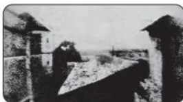
Фото: Вид з вікна у Ле-Гра 1826, Нісефор Ньєпс

Проте за допомогою цього механізму можливим було лише дивитись на зображення, а не зберегти його. До тих пір, поки науковець Нісефор Ньєпс, експериментуючи з камерою-обскура, зробив найважливіший пролив у фотографії — а саме, зробив перший знімок в історії.