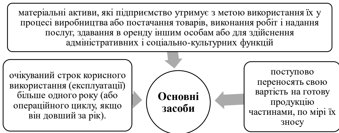
Рис. 1. Ключові характеристики основних засобів підприємства

Ключові характеристики ОЗ показано на рис. 1.