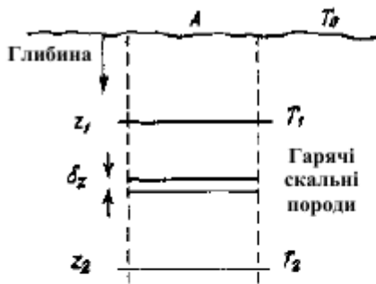
Рисунок 2 – Схема для розрахунку запасу тепла сухих гірських порід (щільність \rho_r , питома теплоємність c_r , температурний градієнт dT/dz=G ; A – площа; T_0 – поверхнева температура; T_1 – мінімальна корисна температура; T_2 – температура на максимальній глибині)

Для однорідного матеріалу у відсутність конвекції з глибиною температура збільшуватиметься лінійно. Якщо z зростає по напрямку від поверхні Землі (де z = 0 ), то