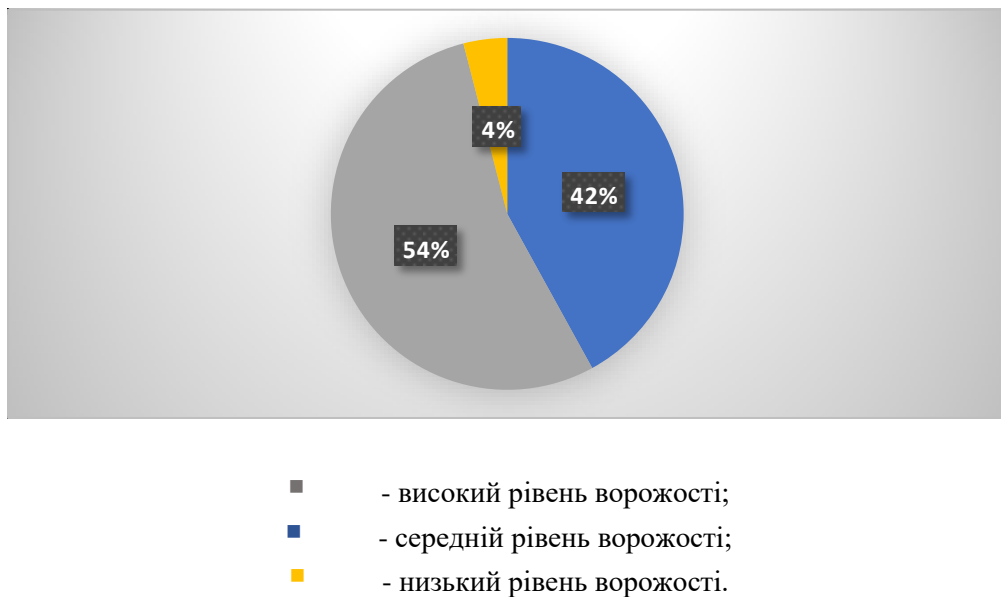
Рис.1. Рівні ворожості за діагностикою стану агресії Басса-Дарки

Результати методики показали, що у молодших школярів за індексом ворожості виявлено три рівні агресивних реакцій. Високий рівень ворожості має 54% (16 осіб). Такі школярі відзначаються дратівливістю, їх часто охоплює почуття люті. Також вони відчувають негативізм, образу, роздратування, недовіру до навколишнього світу. Наголошують на наявності ворогів, кривдників, до яких відчувають ворожі почуття. Часто не можуть упоратися з бажанням завдати шкоди іншим людям з метою захисту своїх інтересів.