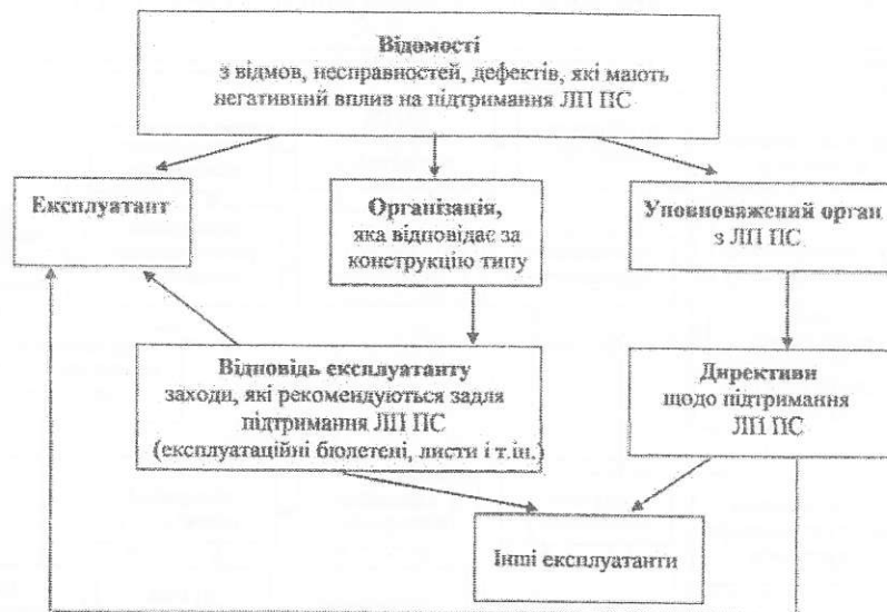
Рисунок 1.1 – Обмін інформацією в системі підтримання ЛП ПС (перший рисунок першого розділу першого підрозділу)