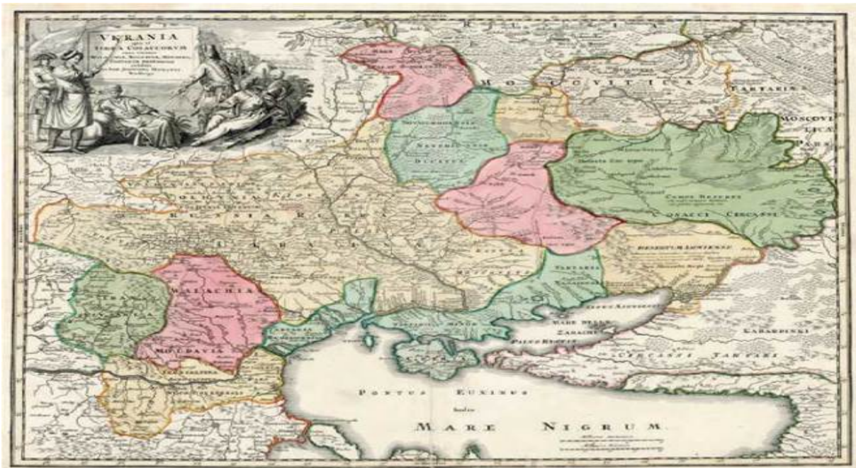
Карта «Україна – земля козаків...». Йоганн Баптист Гоманн, 1720 р.

Джерело: https://uk.wikipedia.org/wiki/%D0%99%D0%BE%D0%B3%D0%B0%D0%BD%D0%BD-%D0%91%D0%B0%D0%BF%D1%82%D0%B8%D1%81%D1%82_%D0%93%D0%BE%D0%BC%D0%B0%D0%BD%D0%BD