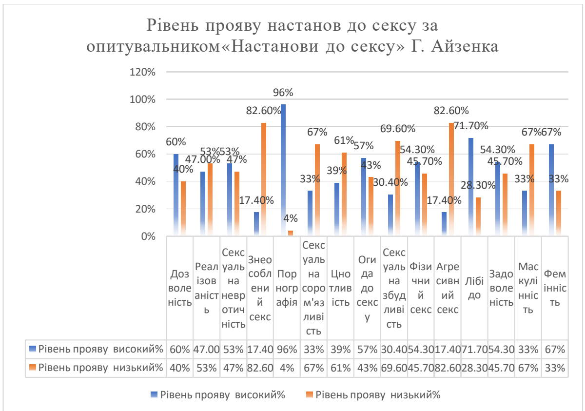
Рис. 2.2.1 Рівень прояву настанов до сексу за опитувальником «Настанови до сексу» Г. Айзенка

Переходячи далі, за рівнем прояву настанов до сексу за опитувальником «Настанови до сексу» Г. Айзенка першою шкалою дослідження була шкала – дозволеність (див. рис.2.2.1.). Високий рівень прояву виявився у 60% (28 респондентів від вибірки), це свідчить про сучасне, навіть більш легке ставлення до сексу. Респонденти навіть можуть рішуче виступати проти релігійних уявлень про сексуальні відносини, про вірне та гріховне у цій сфері людських відносин. Секс респондентами розглядає як задоволення, яке має бути присутнім в будь-якому віковому періоді, якщо цього хочуть двоє партнерів. Дозволеність у виборі партнера та можлива різноманітність зв'язків. Низький бал за цією шкалою отримали 40% (18 респондентів від вибірки), що дає сенс стверджувати, що ці люди відносяться до статевих зв'язків серйозно, відповідально, вони поважають шлюбні узи і не підтримують безглузді зв'язки на одну ніч.