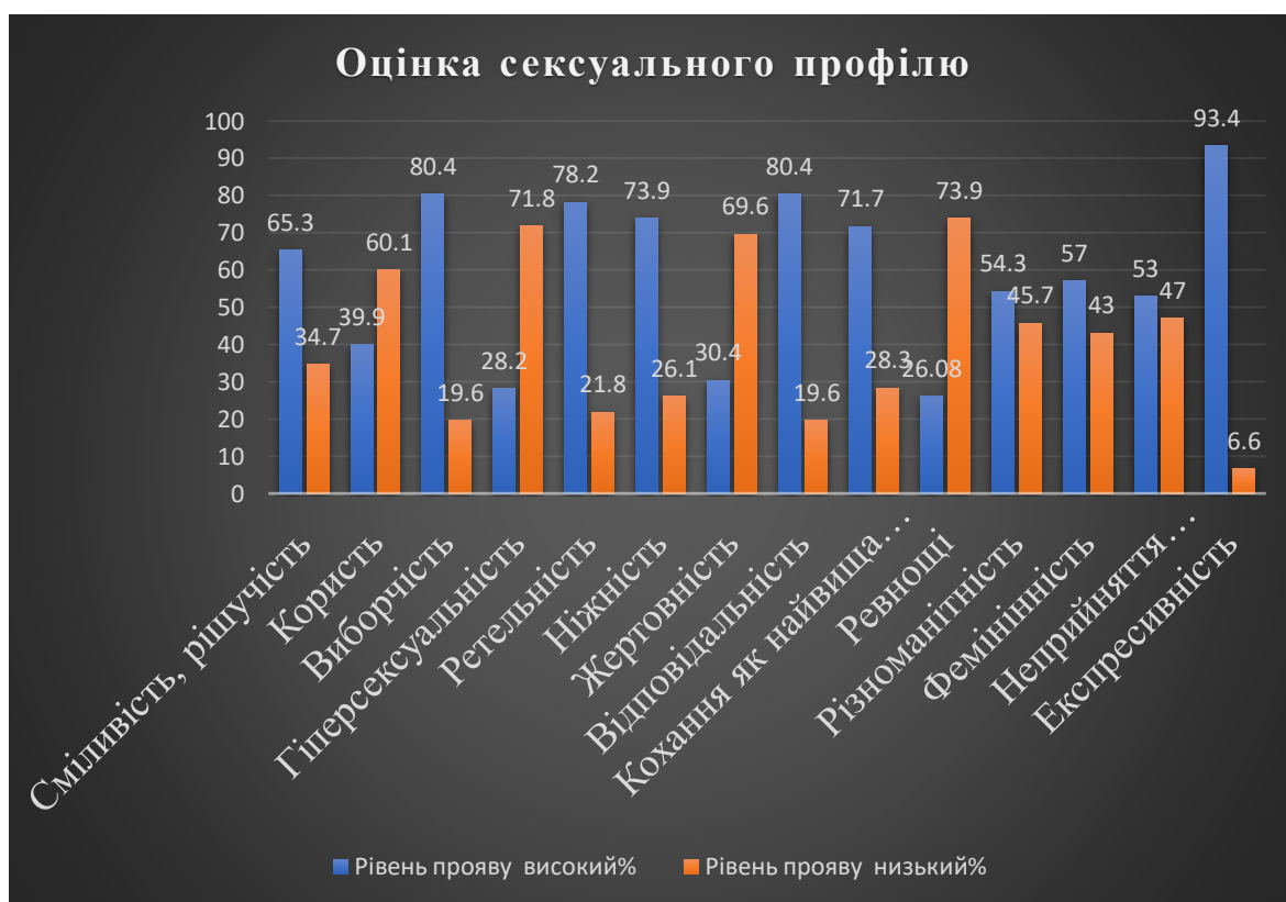
Рис. 2.2.1 Рівень прояву оцінки сексуального профілю за методикою дослідження М. Яффе і Е. Фервік, адаптація О. Потьомкіної.

Для подальшого дослідження нами було віддано перевагу двом методикам: «Опитувальник настанов до сексу Г. Айзенка», «Методика дослідження оцінки сексуального профілю М. Яффе і Е. Фервік», в адаптації О. Потьомкіної (А. Лидерс, 2007).