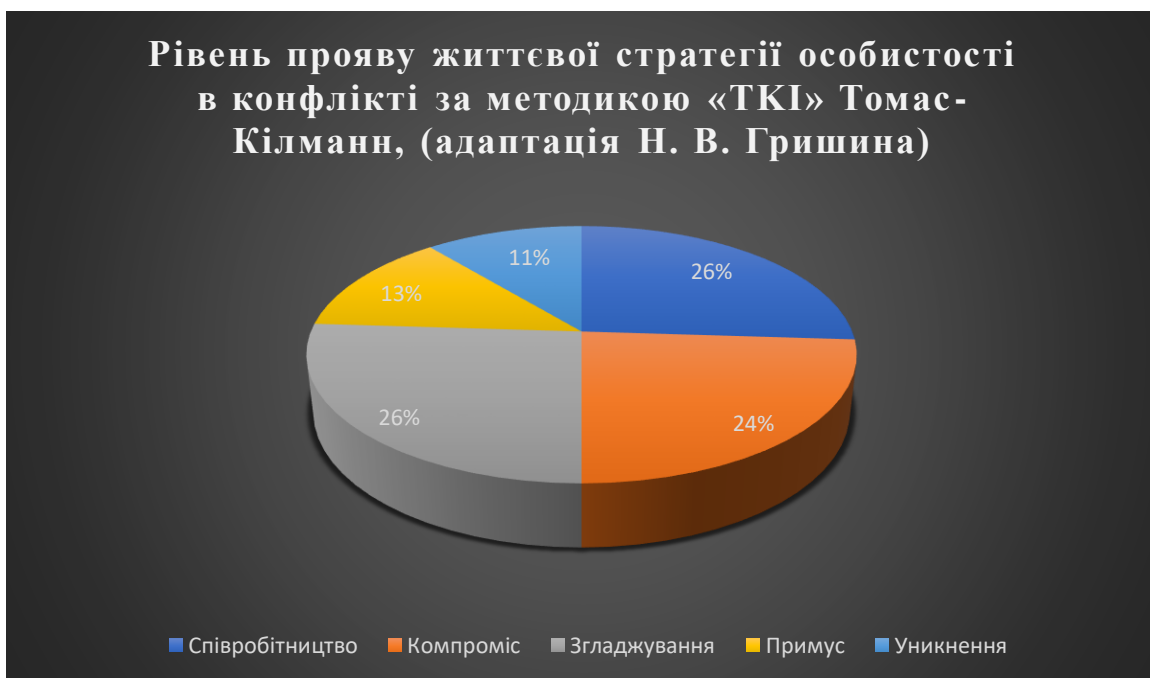
Рис. 2.2.4 Показники рівнів прояву життєвої стратегії особистості в конфлікті за методикою «ТКІ» Томас-Кілманн, (адаптація Н. В. Гришина)

Ілюстративно рівень прояву життєвої стратегії особистості в конфлікті за методикою «ТКІ» Томас-Кілманн, (адаптація Н. В. Гришина) представлено на рис. 2.2.4