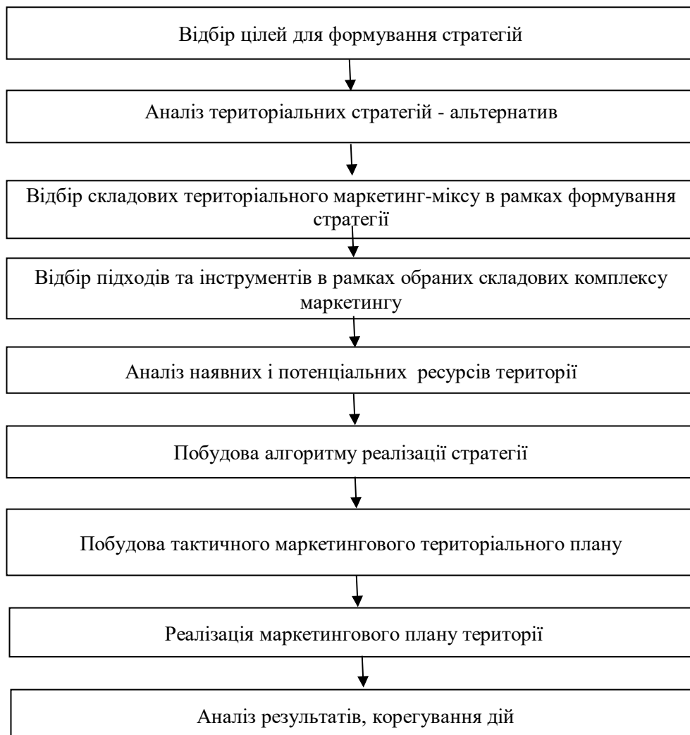
Рисунок 2. Алгоритм реалізації стратегії маркетингу території

Вважаємо, що алгоритм реалізації стратегії маркетингу території на засадах маркетингового інструментарію може бути ґрунтовною основою для організації ефективного менеджменту територій.