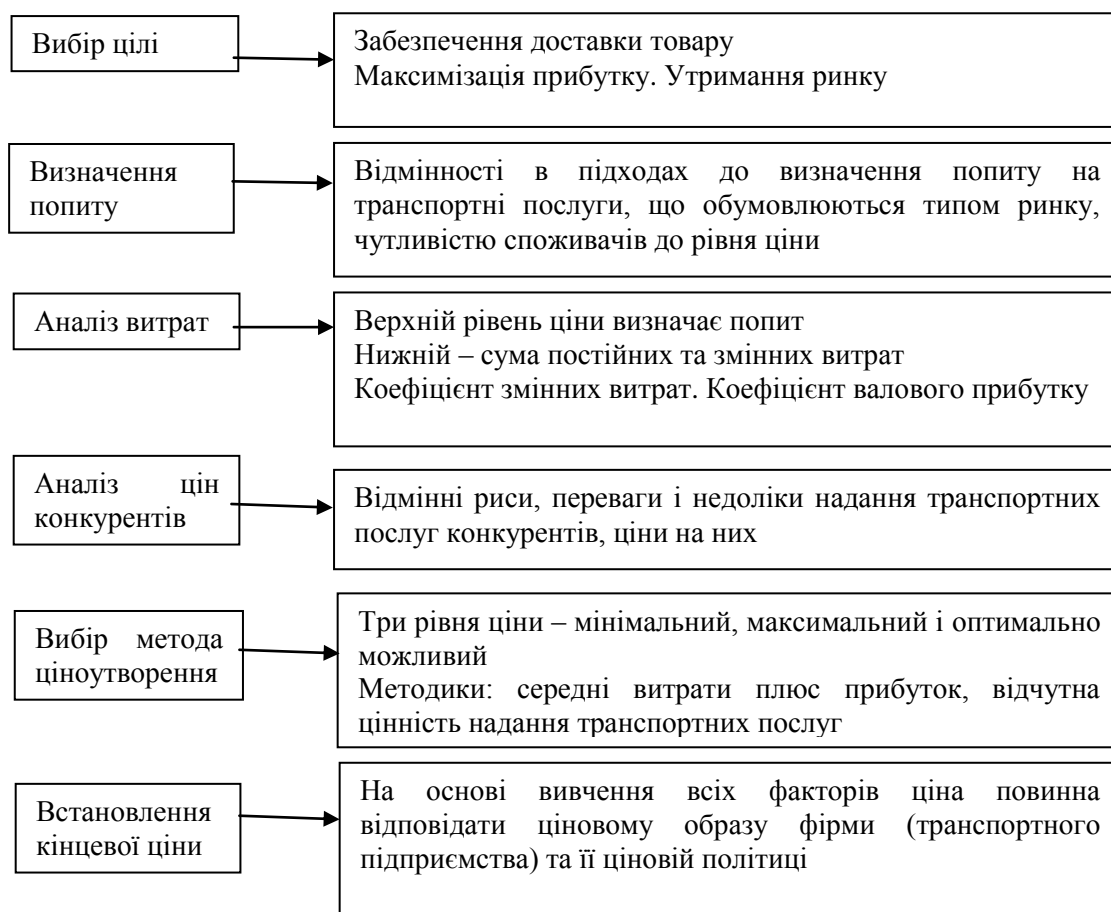
Рис. 1. Етапи ціноутворення