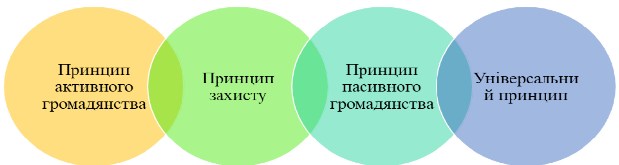
Рис. 2.3. Принципи кримінально-правової юрисдикції у міжнародному співробітництві держав у боротьбі зі злочинністю

При цьому, як зазначає В. Попко, у ході переслідування осіб, обвинувачених у скоєнні міжнародних злочинів, та/або під час вирішення процесуальних питань, має місце виникненню питання кримінально-правової юрисдикції, основні принципи якої представлені на рис. 2.3.