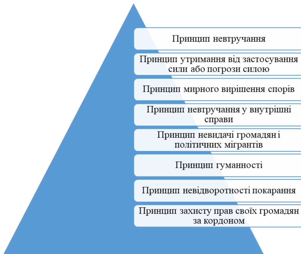
Рис. 2.2. Принципи міжнародного співробітництва держав у боротьбі зі злочинністю

На рис. 2.2 представлені міжнародні принципи, які покладені в основу міжнародного співробітництва держав у боротьбі зі злочинністю.