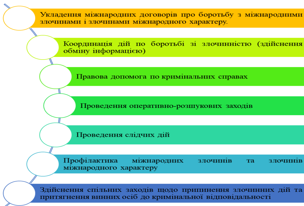
Рис. 2.1. Сучасні форми міжнародного співробітництва держав у боротьбі зі злочинністю

Так, на рис. 2.1 представлені основні форми міжнародного співробітництва держав у боротьбі зі злочинністю.