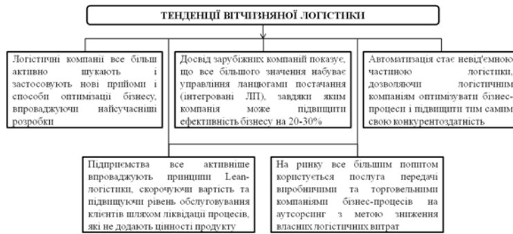
Рис.1. Тенденції вітчизняної логістики

структури, методів прийняття рішень, управління ресурсами, реалізація підтримуючих функцій, систем і процедур [4].