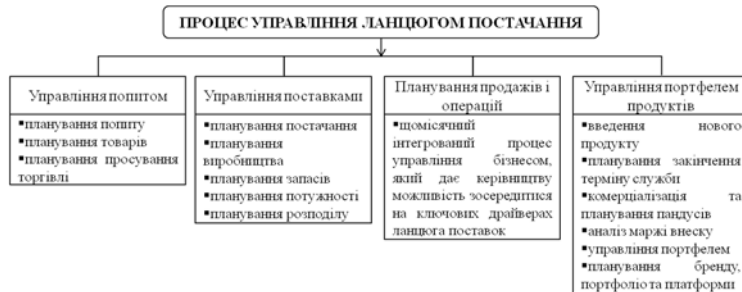
Рис.2. Складові процесу управління ланцюгом поставок

Сам же процес управління ланцюгом поставок складається з чотирьох основних частин, які показано на рис. 2. [5]. Розглянемо більш детально кожен процес.