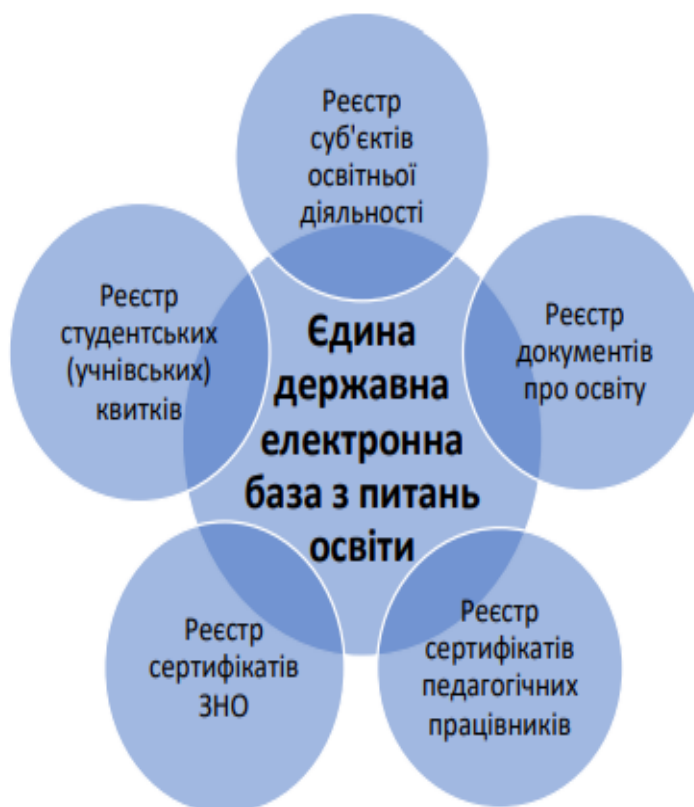
Рисунок 2 – Реєстри Єдиної державної електронної бази з питань освіти.

Активация V Перейдіть до р активувати Wir