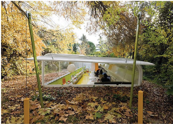
Рисунок 1.6 – Екстер'єр офісу архітектурної фірми Selgas Cano, Мадрид

Не залежно від того чи об'єктом є великий офісний центр чи офісні приміщення однієї компанії, він завжди має свою характерну рису, що легко запам'ятовується, це можуть бути архітектурні елементи в інтер'єрі, форми відокремлення робочих місць, цікаві елементи меблевого наповнення, оригінальність архітектурно – планувального рішення тощо 3 .