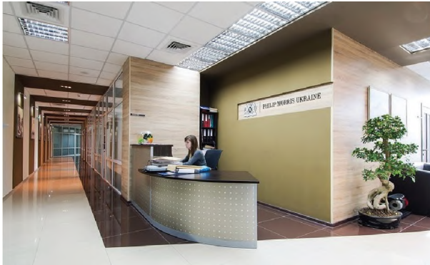
Рисунок 1.7 – Хол і реєстрація офісу компанії “PHILIP MORRIS” в Одесі

досягнута за рахунок використання геометричних ліній у площині підлоги і стін а також використання глянцевих і матових фактурних поверхонь (рис. 1.8).