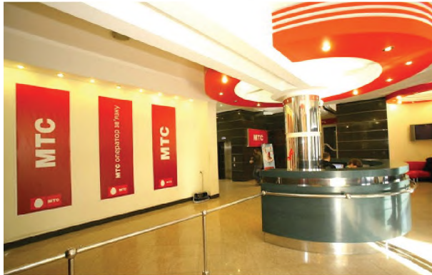
Рисунок 1.13 – Хол і стійка рецесії офісу компанії “МТС Україна”, Київ

використання світлих кольорів в оздобленні і природного та штучного освітлення, що є його перевагою.