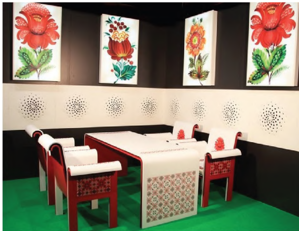
Рисунок 2.1 – Оформлення обідньої зони в українському стилі

5. Національні мотиви у оформленні офісних приміщень можуть зайняти достойне місце. Поєднання елементів українського стилю з сучасним більш строгим стилем, може бути вдалим рішенням для оформлення офісу. Одним з таких елементів може бути орнаментальний ряд.