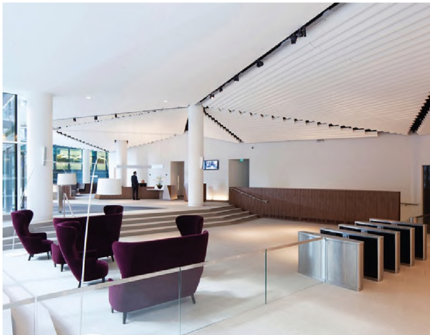
Рисунок 1.2 – Хол “Скляного” офісу компанії Macquarie Group, Лондон

Дизайнерське рішення сходів полягає у фарбуванні її зовнішньої і внутрішньої сторони в елегантний червоний колір, який є координатним центром усього простору і символізує не лише відкритість, але зв'язність у тому числі (рис. 1.3).