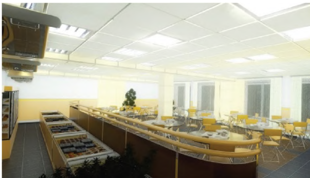
Рисунок 1.11 – Кафе офісу компанії “Інтерпайп”, Київ

Головний хол виконаний також у корпоративних кольорах з великою увагою до фірмового стилю компанії. Використані сміливі форми у оформленні стелі над стійкою рецепції, що привертають до неї увагу (рис. 1.13).