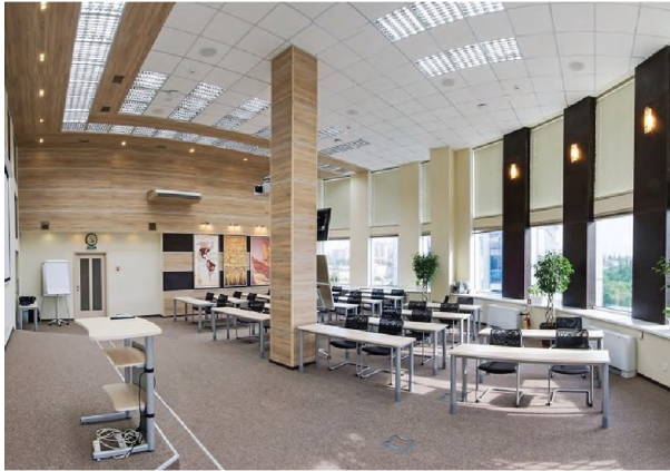
Рисунок 1.9 – Конференц-зал офісу компанії “PHILIP MORRIS” в Одесі

площини підлоги, частково стін, стелі. У приміщенні використовуються велика кількість освітлення різного типу, що в поєднанні з світлими тонами оформлення стін і підлоги створює відчуття легкості і ненав'язливості. Це добре прослідковується у оформленні конференц – залу офісу (рис. 1.9).