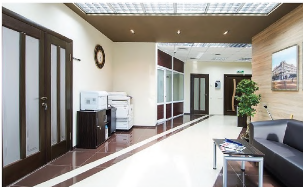
Рисунок 1.8 – Використання геометричних ліній, глянцевих і матових фактурних поверхонь у оформленні інтер'єру офісу компанії “PHILIP MORRIS” в Одесі

Колірна гама інтер'єру нейтральна, за допомогою темних кольорів виконані акцентні частини інтер'єру, оформленні віконні і дверні отвори, меблеве наповнення. Білий і бежевий кольори заповнюють