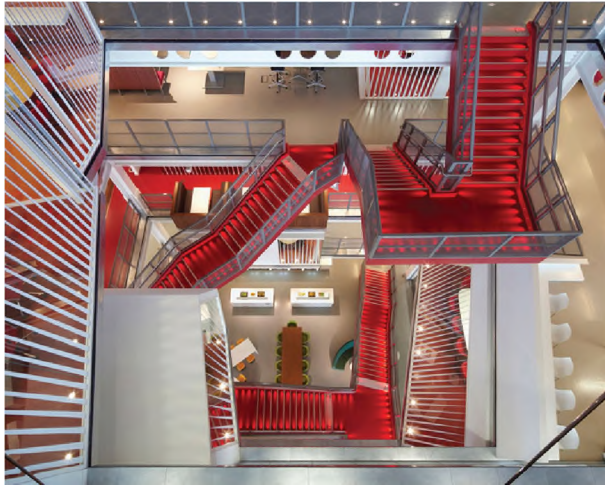
Рисунок 1.1 – “Скляний” офіс компанії Masquarie Group, Лондон

за допомогою простих давно відомих засобів таких як форма, колір, фактура. Кожен проект відрізняється оригінальністю. Оформлення приміщень спрямоване на те, щоб створити простір, зручний для працівників компанії і такий, що легко б запам'ятовувався для відвідувачів, гостей, партнерів. Використання фірмового стилю у проектуванні офісних приміщень невід'ємна складова. Одним з таких проектів є “скляний” офіс компанії Masquarie Group в Лондоні (рис. 1.1).