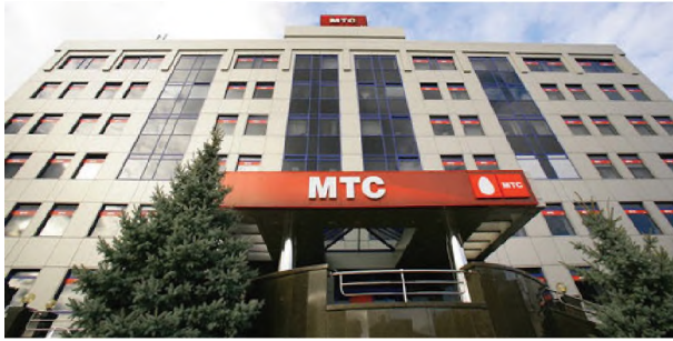
Рисунок 1.12 – Екстер'єр офісу компанії “МТС Україна”, Київ