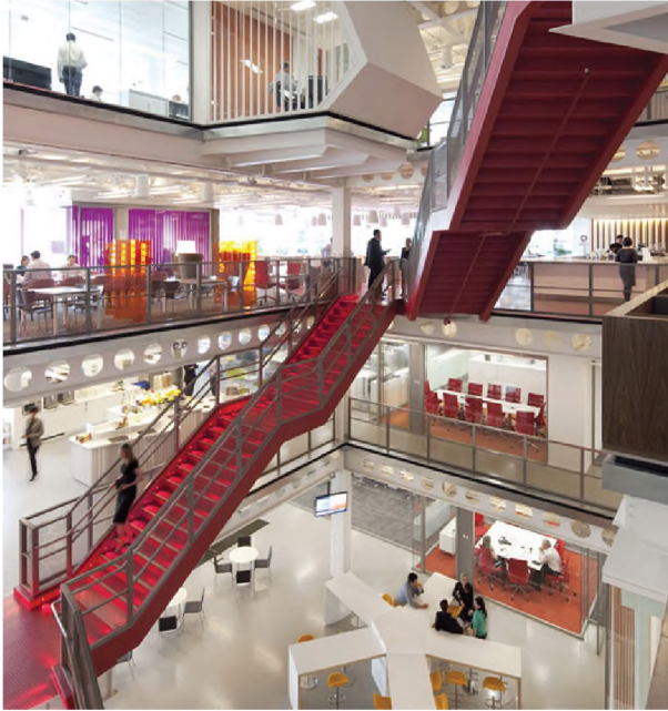
Рисунок 1.3 – Внутрішній простір офісного центру компанії Masquarie Group, Лондон