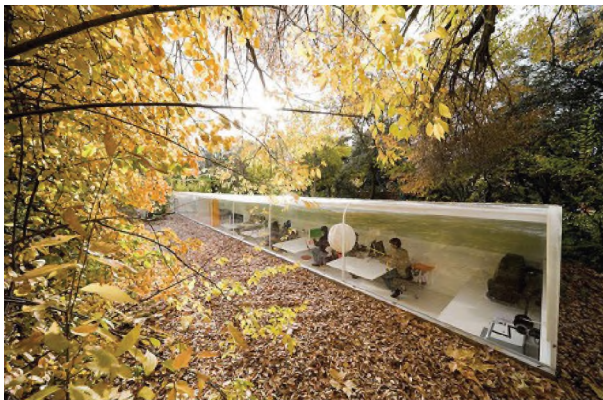
Рисунок 1.4 – Офіс архітектурної фірми Selgas Cano, Мадрид