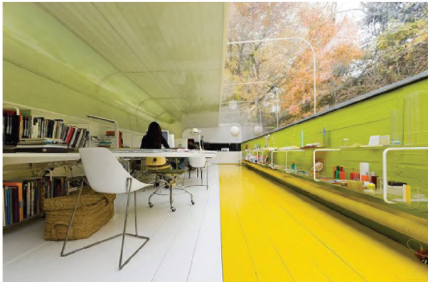
Рисунок 1.5 – Інтер'єр приміщень верхнього рівня офісу архітектурної фірми Selgas Cano, Мадрид

Хосе Селгас і Люсія Кано, керівники компанії, створили для своєї компанії унікальний офіс, використовуючи плексиглас, склопластик і матеріали на основі поліестру.