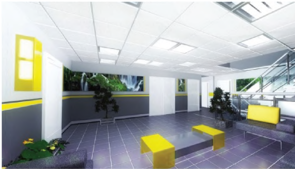
Рисунок 1.10 – Хол офісу компанії “Інтерпайп”, Київ