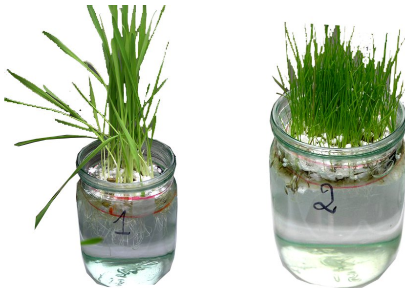
Рис. 4. Определению сорбционной способности мини-биоплото с использованием ячменя и тимофеевки

В следствии этого было принято решение сравнить сорбционные свойства мини-биоплотов с разными видами растений (рис.4).