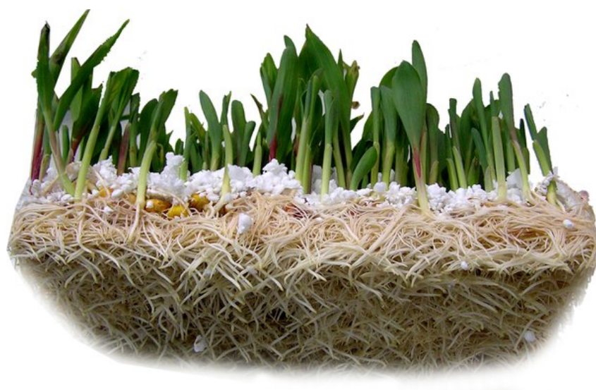
Рис. 1. Связывание корневой системой кукурузы субстрата.

Следующим этапом исследований был поиск оптимального способа комбинирования семян и субстрата, результаты которого приведены в табл. 1.