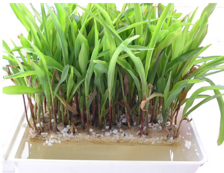
Рис. 2. Проверка плавучести биоплато в лабораторных условиях

В дальнейшем для создания еще более плотного биоплато необходимо оптимизировать размер частиц субстрата и использовать растения с соответствующим размером семян и типом корневой системы.