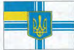
Прапор Міністра оборони України