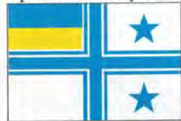
Прапор командира морського району (ескадри)