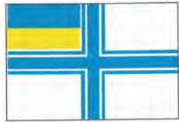
Військово-морський прапор України