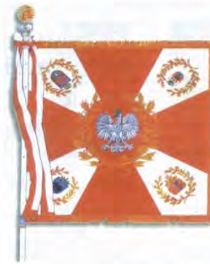
Бойовий прапор спільного українсько-польського батальйону миротворчих сил ООН

ному навчальному центру підготовки молодших спеціалістів, 95-му навчальному центру, Севастопольському військово-морському інституту, Харківському військовому університетові. У 1995 р. вручено два прапори – 4-й окремій бригаді морської піхоти й Прикарпатському військовому округу. На той час були готові для вручення прапори Одеського військового інституту Сухопутних військ, 240-го й 60-го окремих спеціальних батальйонів, 1014-ї бригади Сил протиповітряної оборони, 181-ї учбової артилерійської бригади й Сумського військового інституту артилерії 12 .