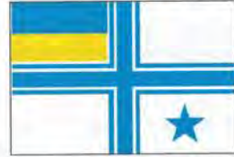
Прапор командира з'єднання