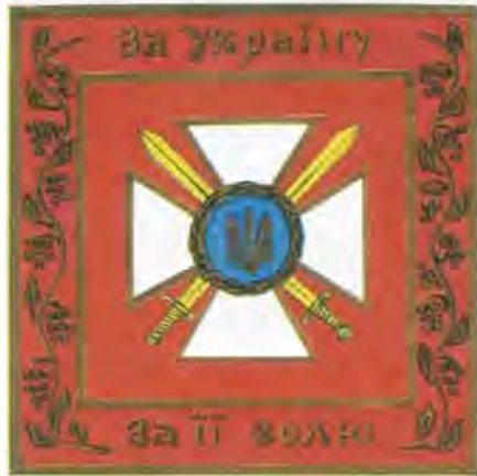
Бойовий прапор військової частини. Автор О.Кохан. Варіант доопрацьований ЦМ ЗСУ

рони України об'єднанням і вищим за рангом частинам, а також ротам Почесної варті.