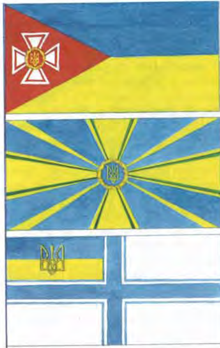
Прапори армії, авіації та флоту. Автори Р.Дуб'як і О.Романчук