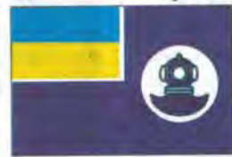
Прапор пошуково-рятувальних суден