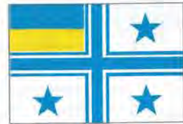
Прапор командувача Військово-морських сил України