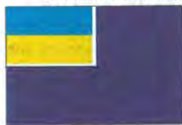
Прапор допоміжних суден