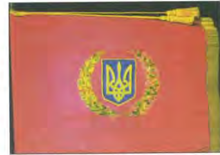
Прапор Сухопутних військ

Розроблене Міністерством оборони Положення про Бойовий прапор військової частини Збройних Сил України визначало, що Бойовий прапор є символом честі, доблесті та слави. Він закликає кожного військовика віддано служити народові України, мужньо, уміло й непохитно боронити Українську державу, не шкодуючи своєї крові й самого життя. Вручення Бойового прапора провадиться після сформування частини посадовими особами Міністерства оборони України від імені Президента України як Верховного Головнокомандувача Збройних Сил. Вручення відбувається в урочистій обстановці з шикунням усього особового складу частини. При цьому частині вручається Грамота Президента України. Після вручення прапор уже завжди зберігається у військовій частині. Під час бою особовий склад зобов'язаний самовіддано й мужньо захищати його і не допускати захоплення супротивни-