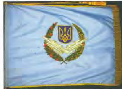
Прапор Сил протиповітряної оборони. Розроблений з ініціативи О.Стеценка

Вручення нових прапорів розпочалося разом з утворенням нових військових частин і установ. Перший український Бойовий прапор військової частини був вручений 1 червня 1994 року 1-й аеромобільній дивізії. Другий – 1 вересня того ж року Академії Збройних Сил України (нині – Національна академія оборони України). Усього в 1994 р. вручено 10 бойових прапорів: Київському військовому інституту управління та зв'язку, Київському інституту Сухопутних військ, Київському інституту Військово-повітряних сил, Київському військовому ліцею, 169-му окруж-