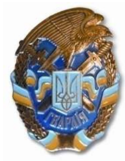
рис. Б.2.18. Знак військової майстерності військовослужбовців рядового та сержантського складу Національної гвардії України [202, 11].