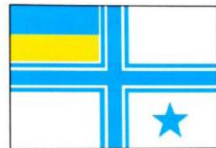
рис. А.40.8. Прапор командира з'єднання