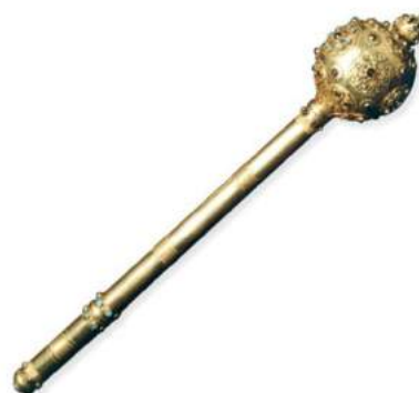
рис. А.26.4 Булава Президента України.