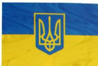
рис. А.48.1. Гюйс

рис. А.48. Посадові прапори Морських сил Державної прикордонної служби України [140, 257, 258]