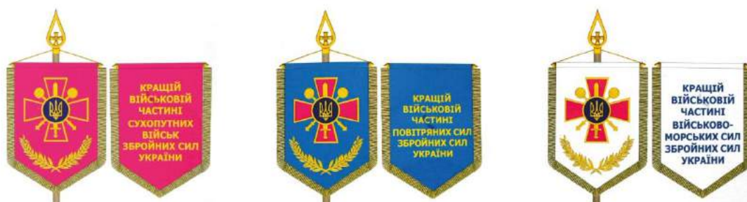
рис. А.41. Перехідні вимпели Міністра оборони України кращим військовим частинам. 2006 р. [140, 115]