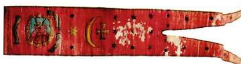
рис. А.14. Січова курінна хоругва 1772 р. [164, 65]