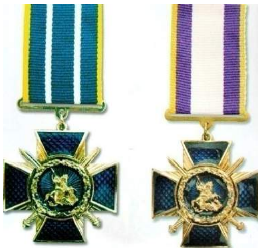
рис. Б.1.13. Заохочувальна відзнака Державної служби надзвичайних ситуацій «За відвагу у надзвичайній ситуації» I та II ступенів [124, 287].

рис. Б.1.12. Заохочувальна відзнака Служби безпеки України «Хрест доблесті» I та II ступенів [124, 277].