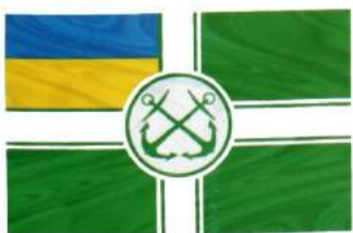
рис. А.48.5. Прапор Командувача Морськими силами