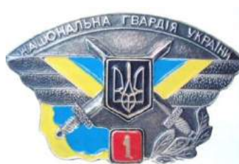
рис. Б.2.19. Знак військової майстерності військовослужбовців офіцерського складу Національної гвардії України [202, 10].