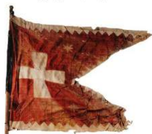
рис. А.7. Козацька хоругва з колекції Військового музею Швеції (Стокгольм) [164, 63]