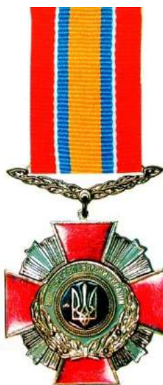
рис. Б.1.8. Відзнака Міністерства оборони України «Доблесть і честь» [124, 116].