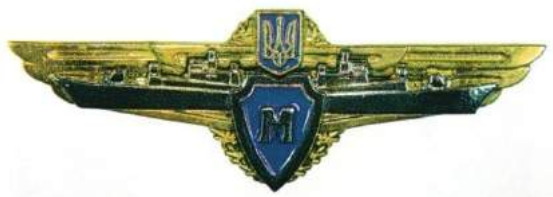
рис. Б.2.17. Знак військової майстерності «Гвардія» Національної гвардії України [202, 8].