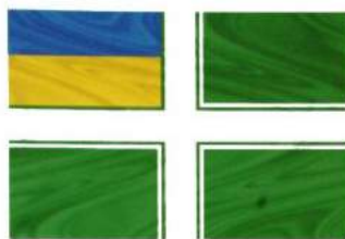
рис. А.48.2. Військово-морський прапор Державної прикордонної служби України