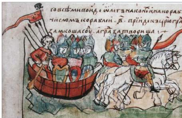
рис. А.1. «Похід Олега на греків» 907 р. Малюнок XIII ст. Радзивилівський (Кенінгзбергський) літопис. [164, 44]