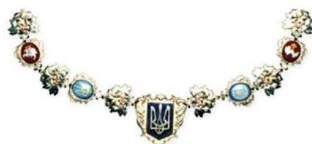
рис. А.26.2 знак Президента України