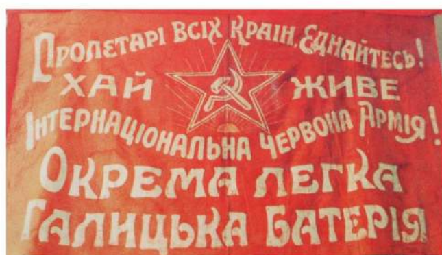
рис. А.23. Прапор Окремої легкої Галицької артилерійської батареї Робітничо-Селянської Червоної Армії. 1920 р. [419]