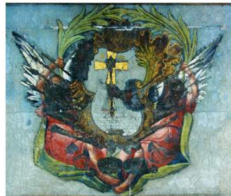
рис. А.11. Хоругва Сечанської (?) сотні Лубенського полку. Аверс і реверс. 1758 р. [164, 70]