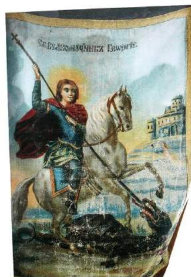
рис. А.19. Хоругва Української Галицької Армії. Фрагмент. [164, 76]