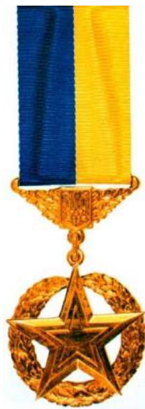
рис. Б.1.2. Знак і зірка ордена «За заслуги» I ступеню та II і III ступенів [124, 56 - 57].

рис. Б.1.1. Знак ордена «Золота зірка» [124, 55].