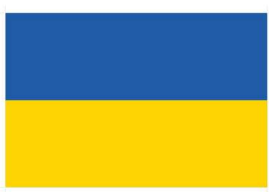
рис. А.25. Державний Прапор України. 1992 р. [416]