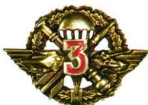
рис. Б.2.6 Знак військової майстерності військовослужбовців рядового та сержантського складу Повітряних сил Збройних Сил України, які проходять службу за контрактом_(трьох ступенів та майстер) [124, 140].

рис. Б.2.5 Знак військової майстерності військовослужбовців рядового та сержантського складу Сухопутних військ Збройних Сил України, які проходять службу за контрактом_(трьох ступенів та майстер) [124, 136].