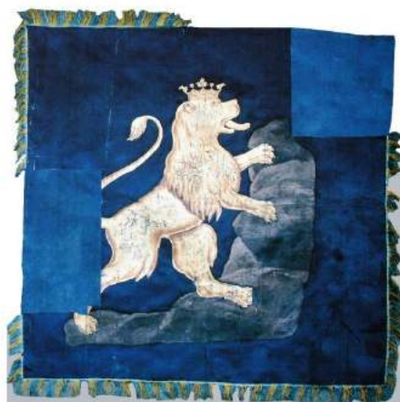
рис. А.18. Хоругва Національної гвардії. 1848 р. [164, 348]