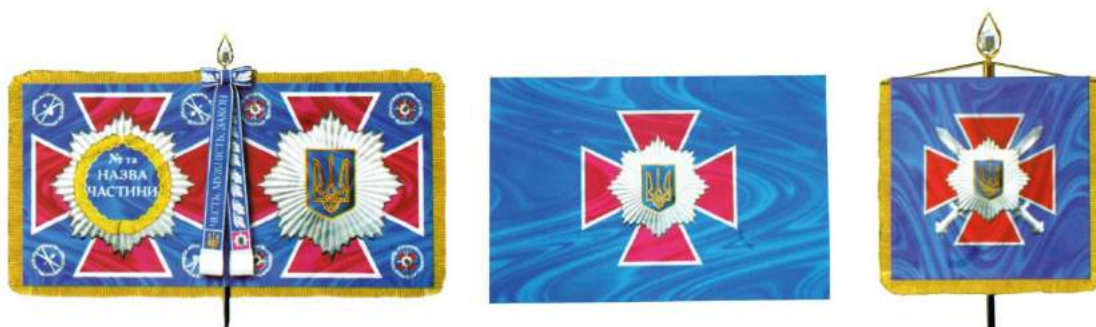
рис. А.44. Бойовий прапор військової частини, прапор Внутрішніх військ та штандарт Командувача Внутрішніх військ Міністерства внутрішніх справ України. 2002 р. [140, 235, 236]