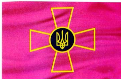
рис. А.34. Емблема та прапор Збройних Сил України. 2006 р. [128, 52; 140, 112]