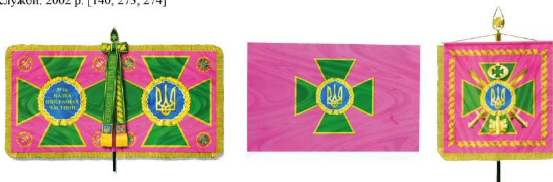
рис. А.46. Бойовий прапор військової частини, прапор Державної прикордонної служби України та штандарт Командувача Державної прикордонної служби України. 2001 р. [140, 255, 256]