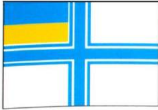
рис. А.40.1. Військово-морський прапор України