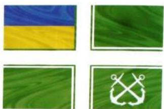
рис. А.48.7. Прапор Командувача з'єднання Морських сил