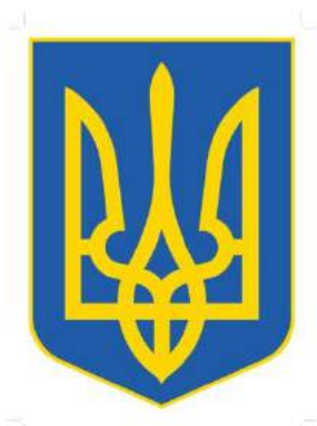
рис. А.24. Державний Герб України. 1996 р. [416]