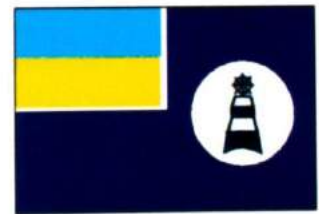
рис. А.40.11. Прапор гідрографічних суден