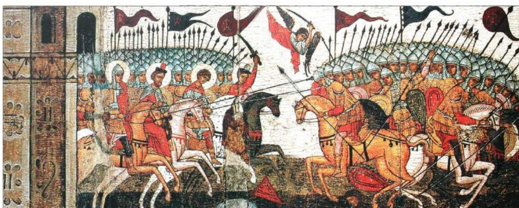
рис. А.3. «Битва новгородців з суздальцями» 907 р. Малюнок XV ст., Фрагмент ікони. [164, 46]