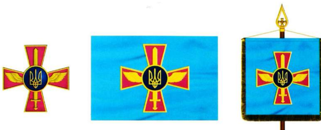
рис. А.38. Емблема і прапор Повітряних сил Збройних Сил України та штандарт Командувача Повітряних сил. 2006 р. [128, 53; 140, 113, 114]