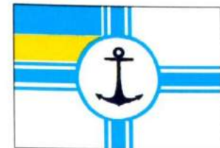
рис. А.40.6. Прапор Начальника штабу Військово-морських сил Збройних Сил України