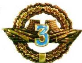
рис. Б.2.7 Знак військової майстерності військовослужбовців рядового та сержантського складу Військово-Морських Сил Збройних Сил України, які проходять службу за контрактом_(трьох ступенів та майстер) [124, 148].

рис. Б.2.6 Знак військової майстерності військовослужбовців рядового та сержантського складу Повітряних сил Збройних Сил України, які проходять службу за контрактом_(трьох ступенів та майстер) [124, 140].