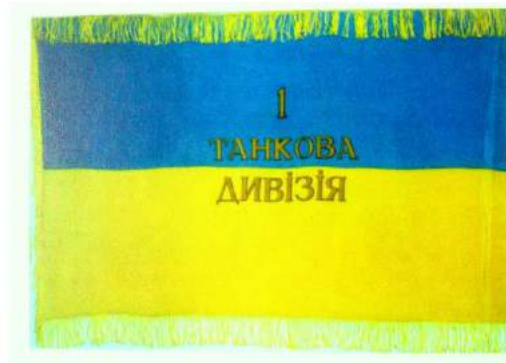
рис. А.29. Бойовий прапор військової частини Збройних Сил України. Аверс і реверс. 1993 р. [128, 24]