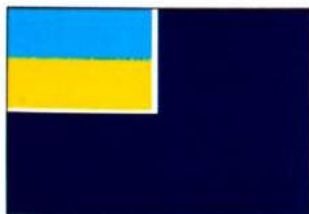
рис. А.40.9. Прапор допоміжних суден