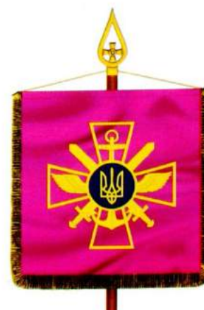
рис. А.36. Емблема і прапор Генерального штабу Збройних Сил України та штандарт Начальника Генерального штабу – Головнокомандувача Збройних Сил України. 2006 р. [128, 52; 140, 112]