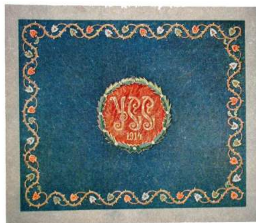
рис. А.17. Хоругва Українських Січових Стрільців. Аверс і реверс. 1917 р. [164, 75]