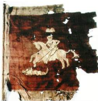
рис. А.9. Козацька хоругва з колекції Військового музею Швеції (Стокгольм) [164, 64]