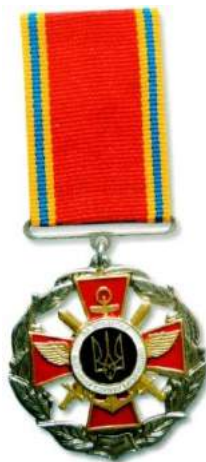
рис. Б.1.10. Заохочувальна відзнака «За сумлінну службу в Державній прикордонній службі України» [124, 260].

рис. Б.1.9. Почесний нагрудний знак начальника Генерального штабу - Головнокомандувача Збройних Сил України «За доблесну військову службу Батьківщині» [124, 126].