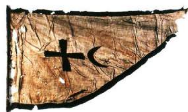
рис. А.8. Козацька хоругва з колекції Військового музею Швеції (Стокгольм) [164, 64]