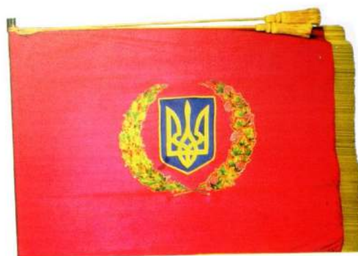
рис. А.31. Прапор Сухопутних військ Збройних Сил України. 1993 р. [128, 26]