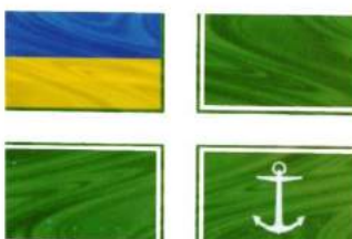
рис. А.48.8. Прапор Командувача військами напрямку