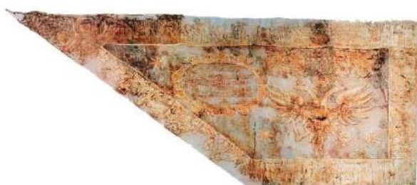
рис. А.5. Хоругва надіслана гетьману Івану Мазепі з Москви. 1686 – 1688 рр. [164, 61]