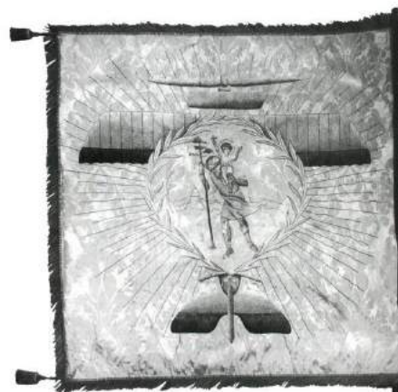
рис. А.21. Прапор 1-ї Запорізької авіаційної ескадрильї Армії Української Народної Республіки. [421, 67; 419, 123]