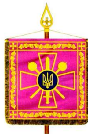
рис. А.35. Емблема і прапор Міністерства оборони України та штандарт Міністра оборони України. 2006 р. [128, 52; 140, 112]