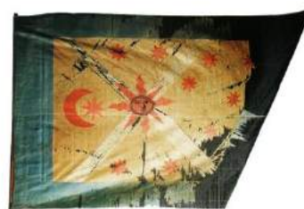
рис. А.6. Козацька хоругва з колекції Військового музею Швеції (Стокгольм) [164, 62]