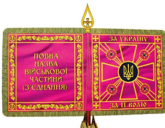
рис. А.42. Бойовий прапор військової частини. 2006 р. [128, 51]