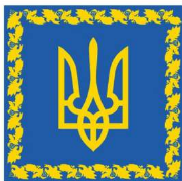
рис. А.26.1 Прапор (штандарт) Президента України