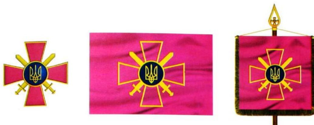
рис. А.37. Емблема і прапор Сухопутних військ Збройних Сил України та штандарт Командувача Сухопутних військ. 2006 р. [128, 53; 140, 113, 114]