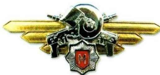
рис. Б.2.22. Знак військової майстерності військовослужбовців Міністерства надзвичайних ситуацій України [ 202, 66].