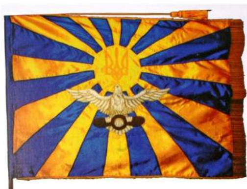
рис. А.30. Прапор Військово-Повітряних Сил Збройних Сил України. 1997 р. [128, 36; 140, 78]