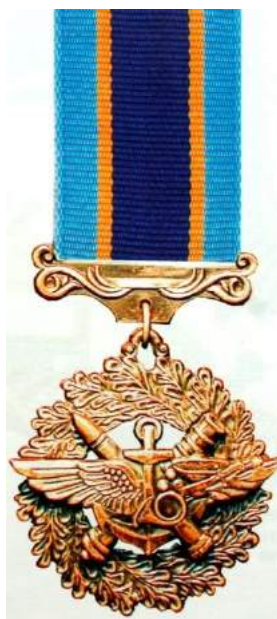
рис. Б.1.7. Відзнака Міністерства оборони України «Знак Пошани» [124, 116].