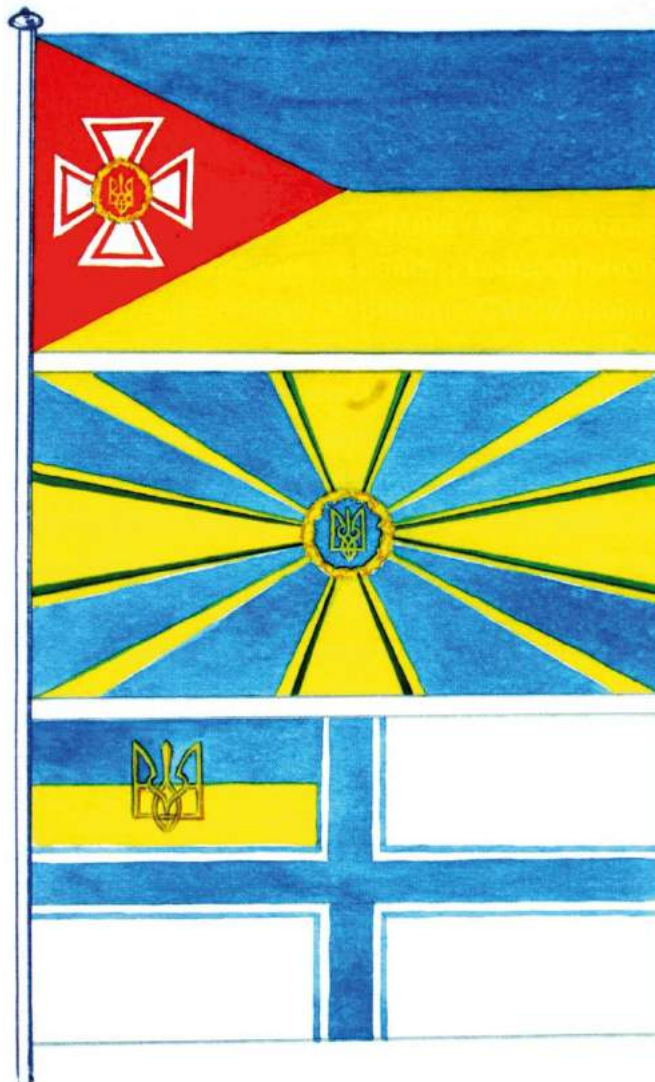
рис. А.28. Ескіз прапорів армії, авіації і флоту. Автори Р. Дуб'як, О.Романчук. 1992 р. [128, 23]