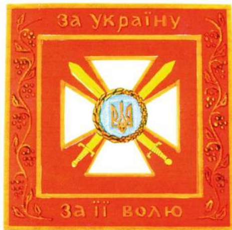
рис. А.27. Ескіз Бойового прапора військової частини Збройних Сил України. Автор О.Кохан. Варіант доопрацьований В.Карповим. 1998 р. [128, 28]