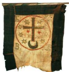
рис. А.12. Хоругва Богдана Хмельницького 1649 – 1654 рр. [164, 60] рис.