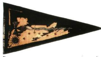
рис. А.13. Козацька хоругва з колекції Військового музею Швеції (Сток- гольм) [164, 64]