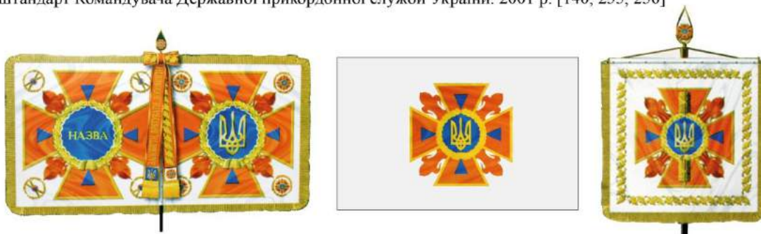
рис. А.47. Бойовий прапор військової частини, прапор Міністерства надзвичайних ситуацій України та штандарт Міністра надзвичайних ситуацій України. 2003 р. [140, 284, 285]