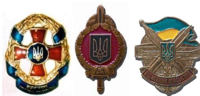
рис. Б.2.2. Знак класної кваліфікації військовослужбовців строкової служби Збройних Сил України (трьох ступенів) [124, 138].

рис. Б.2.1. Знаки Відмінник Збройних Сил України, Відмінник військ Протиповітряної оборони Збройних Сил України військовослужбовців строкової служби [124, 138, 145].