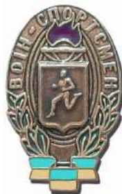
рис. Б.2.5 Знак військової майстерності військовослужбовців рядового та сержантського складу Сухопутних військ Збройних Сил України, які проходять службу за контрактом_(трьох ступенів та майстер) [124, 136].

рис. Б.2.4. Знак «Воїн-спортсмен» військовослужбовців строкової служби Збройних Сил України [124, 138].