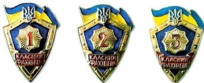
рис. Б.2.21. Знак військової майстерності військовослужбовців офіцерського складу Внутрішніх військ Міністерства внутрішніх справ України [124, 240].