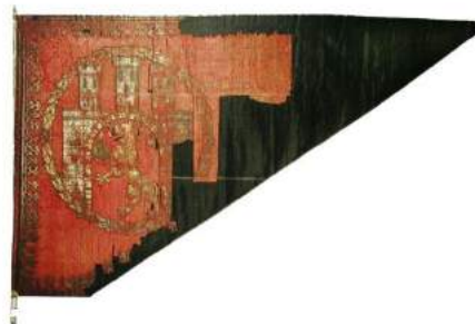
рис. А.10. Хоругва міської гвардії міста Львова. Друга пол.. XVII ст. [164, 56]