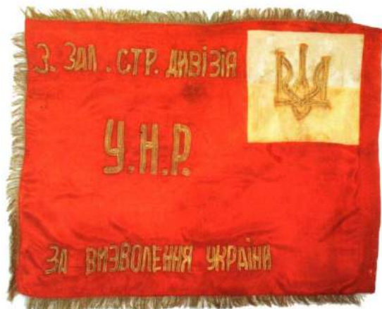
рис. А.20. Прапор 3-ї Залізної стрілецької дивізії Армії Української Народної Республіки. 1919 р. [140, 25; 128, 21]