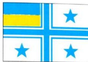
рис. А.40.5. Прапор Командувача Військово-морських сил Збройних Сил України