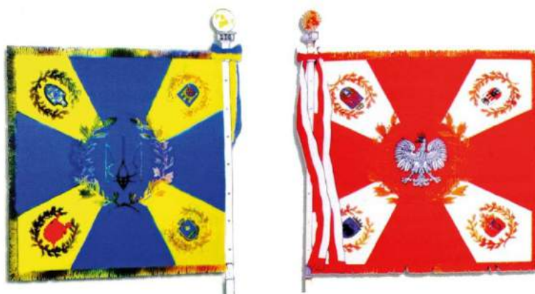
рис. А.43. Бойовий прапор українсько-польського батальйону миротворчих сил ООН. 1995 р. [128, 37]