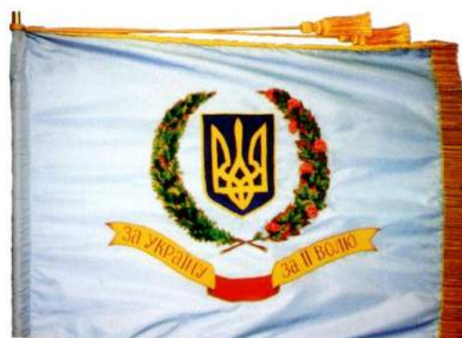
рис. А.33. Прапор Військ Повітряної оборони Збройних Сил України. 1993 р. [128, 26]