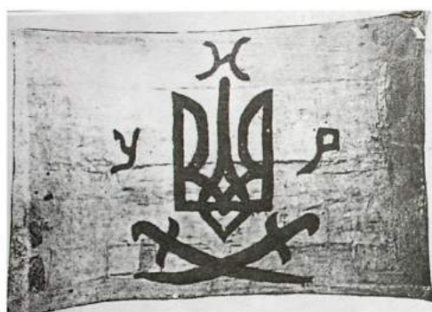
рис. А.22. Прапор 1-го Лубенського кінного полку імені Максима Залізняка Армії Української Народної Республіки. Аверс і реверс. 1918 р. [419, 122]