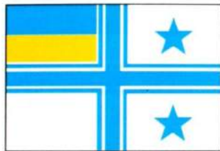
рис. А.40.7. Прапор Командира морського району (ескадри)