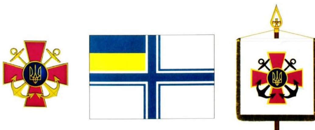
рис. А.39. Емблема і прапор Військово-морських сил Збройних Сил України та штандарт Командувача Військово-морських сил. 2006 р. [128, 53; 140, 113, 114]