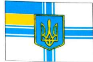
рис. А.40.3. Прапор Міністра оборони України