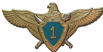
рис. Б.2.10. Знак майстерності штурман-снайпер Повітряних Сил Збройних Сил України [124, 141].