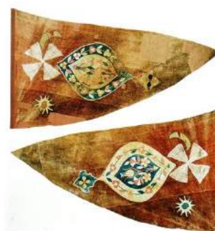
рис. А.16. Козацька хоругва з колекції Вій- ськового музею Швеції (Стокгольм) Аверс і реверс. Перша пол. – середина XVII ст.. [164, 62]