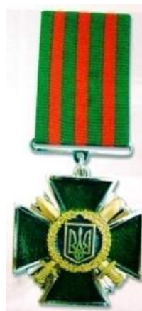
рис. Б.1.11. Заохочувальна відзнака Служби безпеки України «За мужність і відвагу» [124, 275].

рис. Б.1.10. Заохочувальна відзнака «За сумлінну службу в Державній прикордонній службі України» [124, 260].