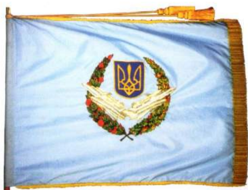
рис. А.32. Прапор Військ Протиповітряної оборони Збройних Сил України. 1997 р. [128, 36; 140, 78]