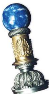
рис. А.26.3 Гербова печатка Президента України