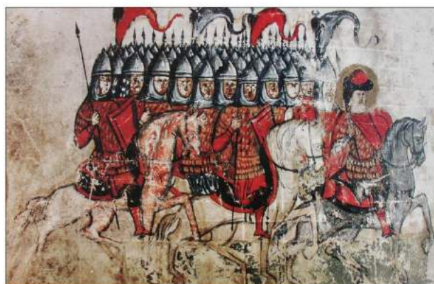
рис. А.2. «Похід Бориса на печенігів» 1015 р. Малюнок XIV ст., зі «Сказанія про Бориса і Гліба». [164, 45]