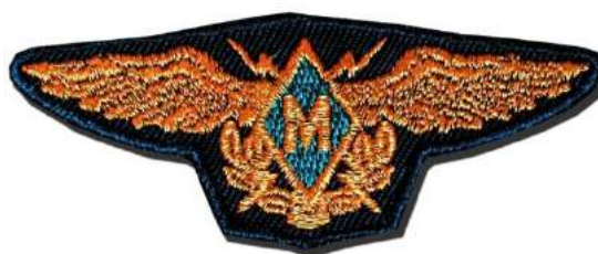
рис. Б.2.15. Знак військової майстерності військовослужбовців офіцерського складу Сил Протиповітряної оборони Повітряних Сил Збройних Сил України (три ступені та майстер) [124, 145].