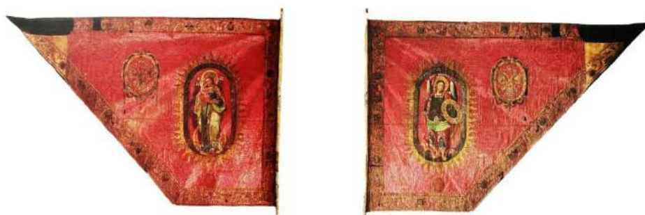
рис. А.4. Полкова хоругва із гербами полковника Михайла Миклашевського та гетьмана Івана Мазепи. Реверс і аверс. 1690 – 1696 рр. [164, 66, 67]