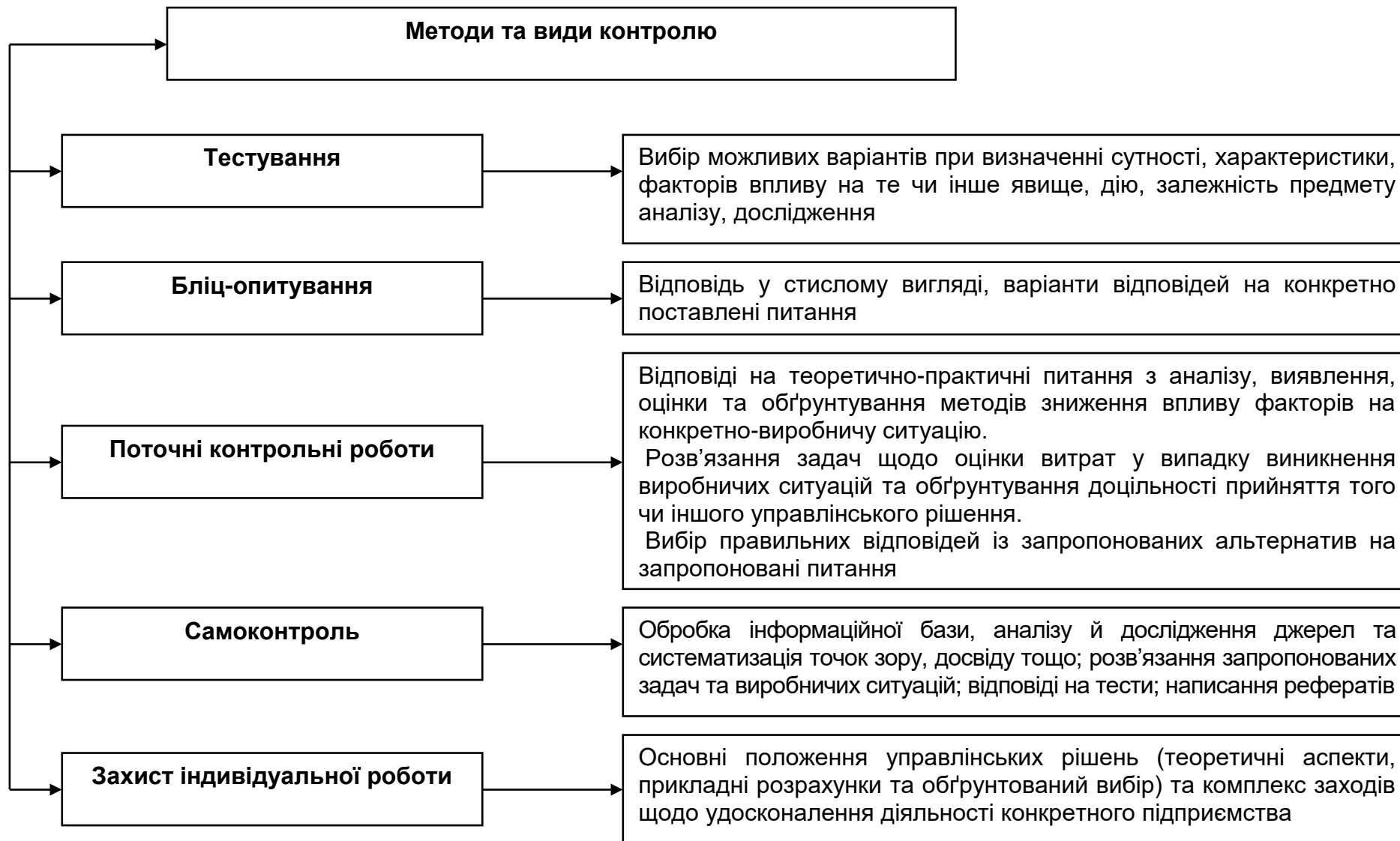
Рис. 3. Пропоновані методи та види контролю