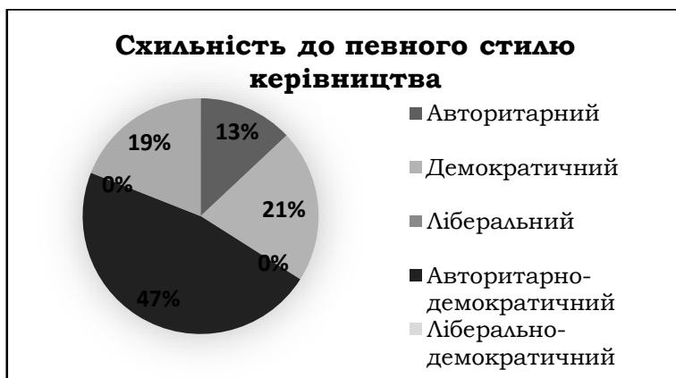
Рис. 5. Діаграма розподілу схильності до певного стилю керівництва у студентів (Ільїн).

тоді як до «чистих» стилів, а саме демократичного та авторитарного, волюють, відповідно, лише 21,3 та 12,8% досліджуваних; схильності до використання ліберального стилю у них не виявлено.