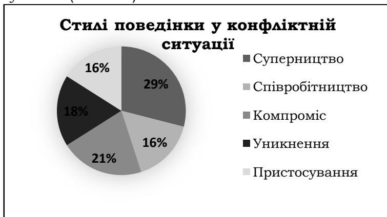
Рис. 4. Діаграма розподілу стилів поведінки студентів у конфліктній ситуації (Томас)

Виявлення стилю поведінки у конфліктній ситуації за методикою Томаса показало, порівняно з наведеними вище даними, відсутність відмітного домінування у студентів одних стилів над іншими. Так, у виборі студентами стилів спілкування у конфліктній ситуації незначною мірою преважують такі стилі, як суперництво (29%) та компроміс (21%). Інші ж стилі (уникнення, співробітництво, пристосування) майже рівномірно представлені у решті досліджуваних (18-16%).