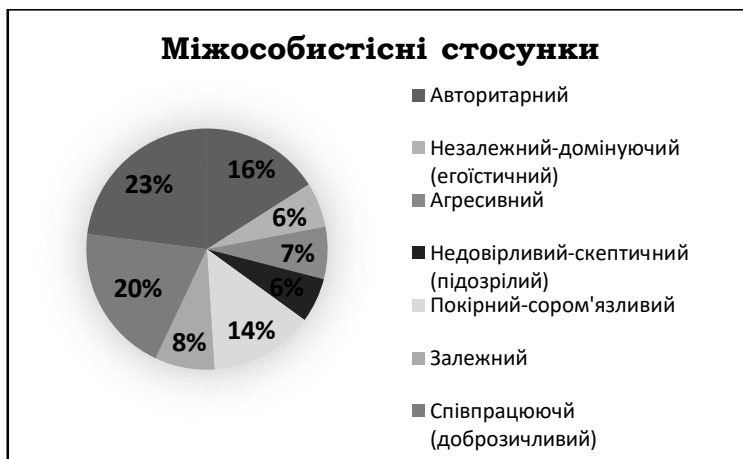
Рис. 1. Діаграма розподілу типів міжособистісних стосунків у студентів (Лірі)

Вивчення стилів міжособистісної взаємодії (за методикою Максимова, Лобейко) показало переважання у студентів колегіального (36%) та ліберального (34%) стилів, а діловий (16%) та директивний (14%) стилі виявилися менш вживаними.