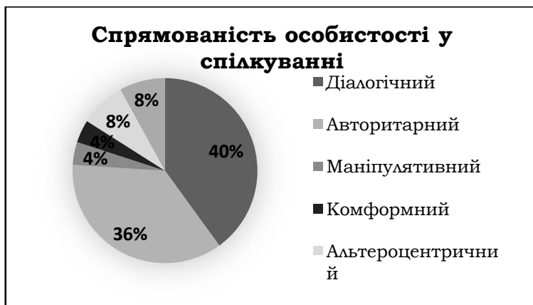
Рис. 3. Діаграма розподілу спрямованості студентів у спілкуванні (Братченко).

Виявлення стилю поведінки у конфліктній ситуації за методикою Томаса показало, порівняно з наведеними вище даними, відсутність відмітного домінування у студентів одних стилів над іншими. Так, у виборі студентами стилів спілкування у конфліктній ситуації незначною мірою преважують такі стилі, як суперництво (29%) та компроміс (21%). Інші ж стилі (уникнення, співробітництво, пристосування) майже рівномірно представлені у решті досліджуваних (18-16%).