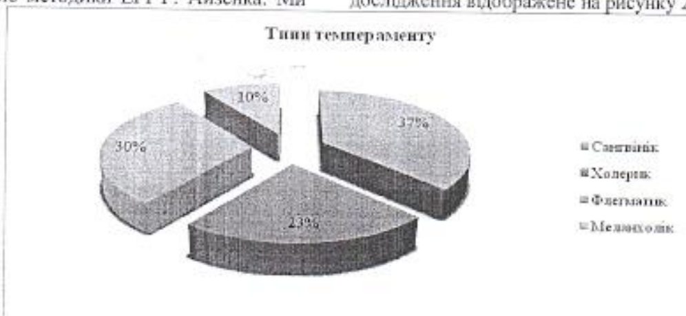
Рис. 2. Типи темпераменту новобранців строкової служби

отримали наступні результати. У 37,5% респондентів сангвіністичний тип темпераменту. Для 22,5% досліджуваних характерний тип темпераменту – холерик. Для 30% військовослужбовців серед всі опитуваних характерний флегматичний тип темпераменту. 10% респондентів серед всі опитуваних складають меланхолічний тип. Графічне зображення показників дослідження відображене на рисунку 2.