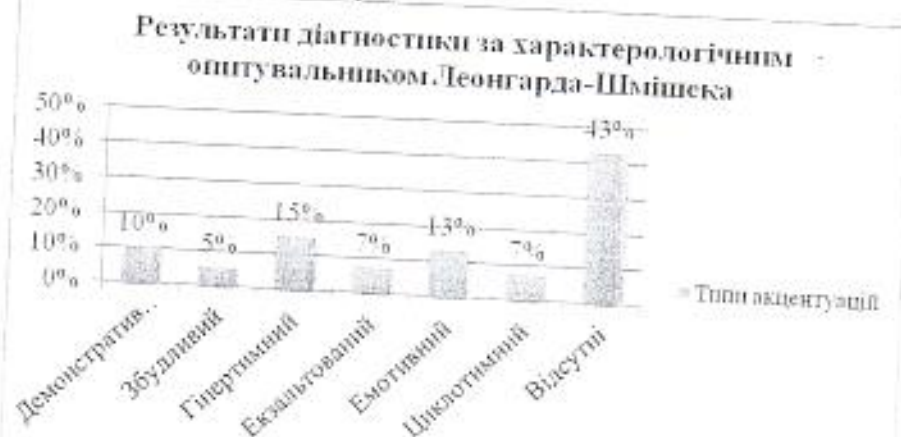
Рис.3. Типи акцентуацій новобранців строкової служби

Діагностика наявності та ступеня розвитку акцентуації характеру особистості з'ясувала, що у 42.5 % досліджуваних відсутні акцентуовані риси характеру. Серед усіх досліджуваних у 15% присутня гіпертимна акцентуація, у 10% респондентів демонстративна, у 5% осіб збудливий тип, у 7.5% досліджуваних ексальтований тип акцентуації, у 12.5% військовослужбовців емотивний тип акцентуації, у 7.5 % особистостей циклотимний тип акцентуації. Кількісні показники представлені на рис.3.